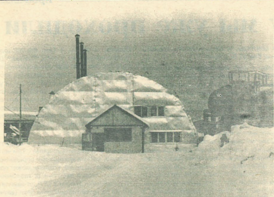
Новый рыбокопильный цех.

жая, им отоваривались, и сделки коммерческие не без его помощи совершались. Так вот, из этого же язя можно будет делать с помощью новой технологии что угодно. Ассортимент рыбной продукции заметно расширится. Можно рассчитывать на то, что к концу года мы сможем покупать фарш и сосиски. Рыбомучная установка позволит выпускать около тонны муки в смену. “Золотой песок” для предприятия.