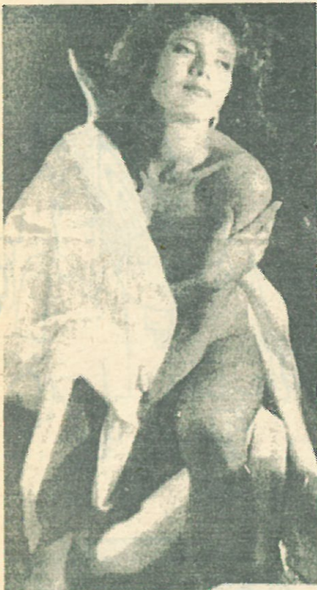
Фотоальбом "СЛ" ждет новых претендентов