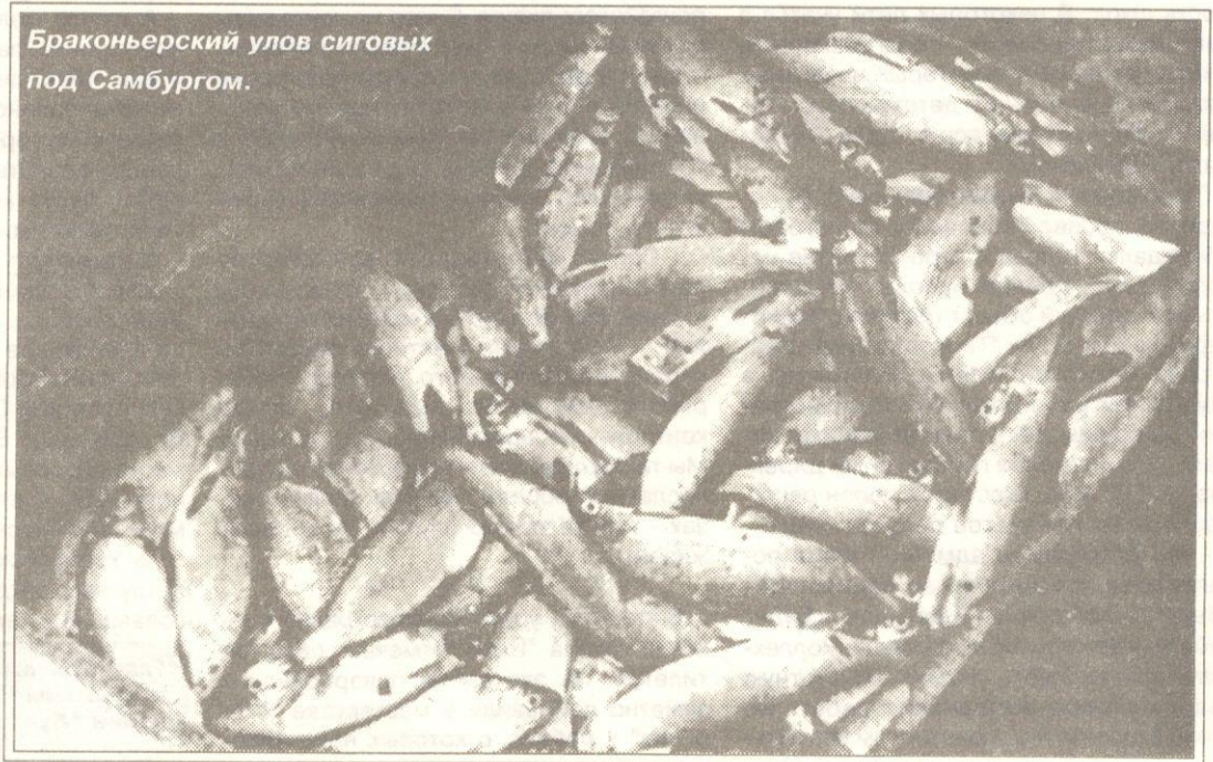
Браконьерский улов сиговых под Самбургом.