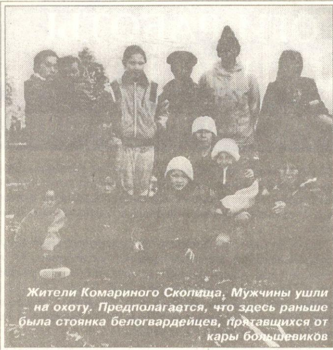
Жители Комариного Скопища. Мужчины ушли на охоту. Предполагается, что здесь раньше была стоянка белогвардейцев, прятавшихся от кары большевиков

К 65-летию Ямало-Ненецкого автономного округа