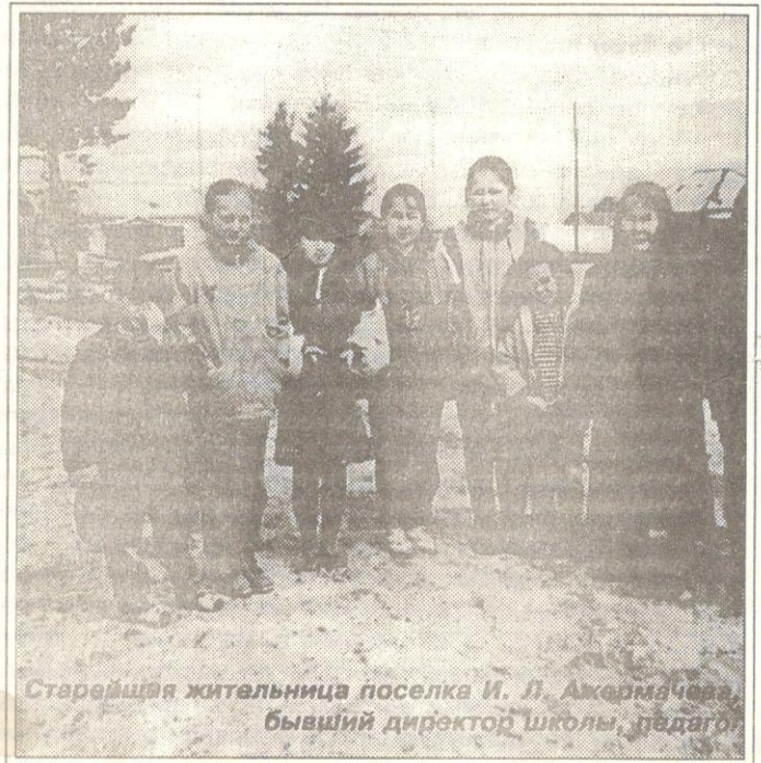
Старейшая жительница поселка И. Л. Ажермачева, бывший директор школы, педагог

- К сожалению, я действительно очень сожалею, в прошлом году она не состоялась. Не было денег. Год потеряли. В этом году администрация района выделила нам 11,5 миллионов, 5 миллионов на приобретение видеокамеры дал комитет народного образования. Я просто хочу донести мысль до руководителей района - писать историю края нелегко, непросто, уход из жизни старожилы, ветераны, мастера уникальные, само-