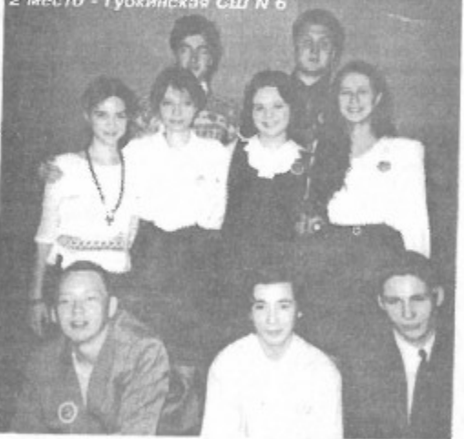
2 место - Губкинская СШ N 6