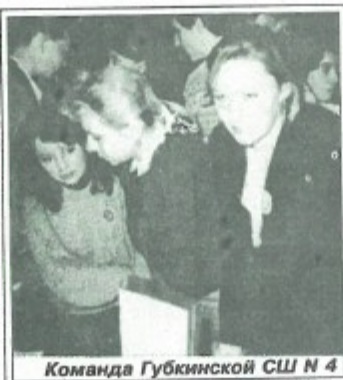
Команда Губкинской СШ № 4

А вообще ребята нам понравились все, и очень хотелось буквально всем поставить высший балл.