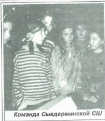
Команда Сывдарминской СШ