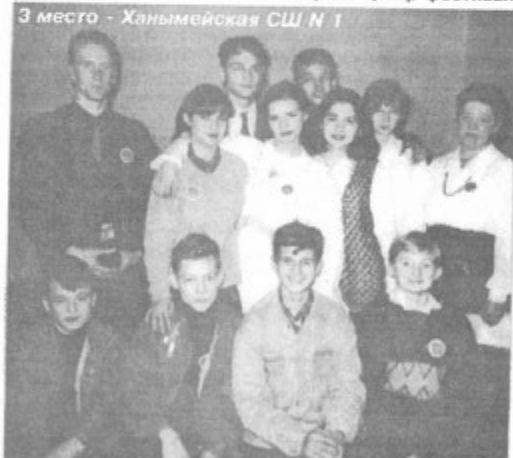
3 место - Ханымейская СШ N 1