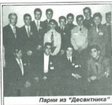
Парни из “Десантника”