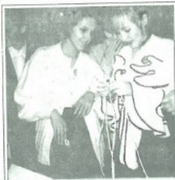
Члены команды Губкинской СШ N 1

Туристы - народ умелый. И костер разожгут, и палатку поставят, и переправу наладят. Многими умениями надо владеть им. На прошлогодних соревнованиях команды демонстрировали знания типов костров, туристского снаряжения. На этот раз им было предложено показать умение вязать узлы.