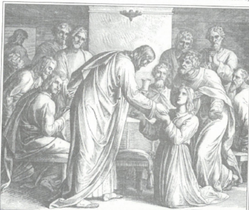
Установление вечери Господней