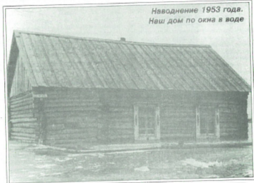
Наводнение 1953 года. Наш дом по окна в воде