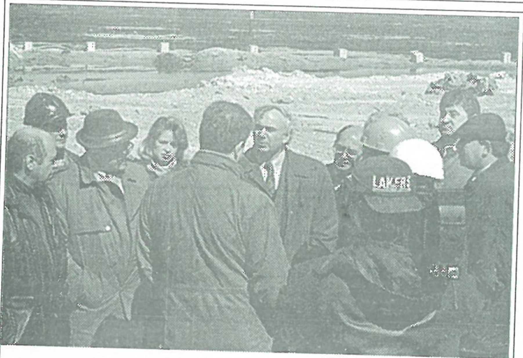
На месторождении "Фестивальное"