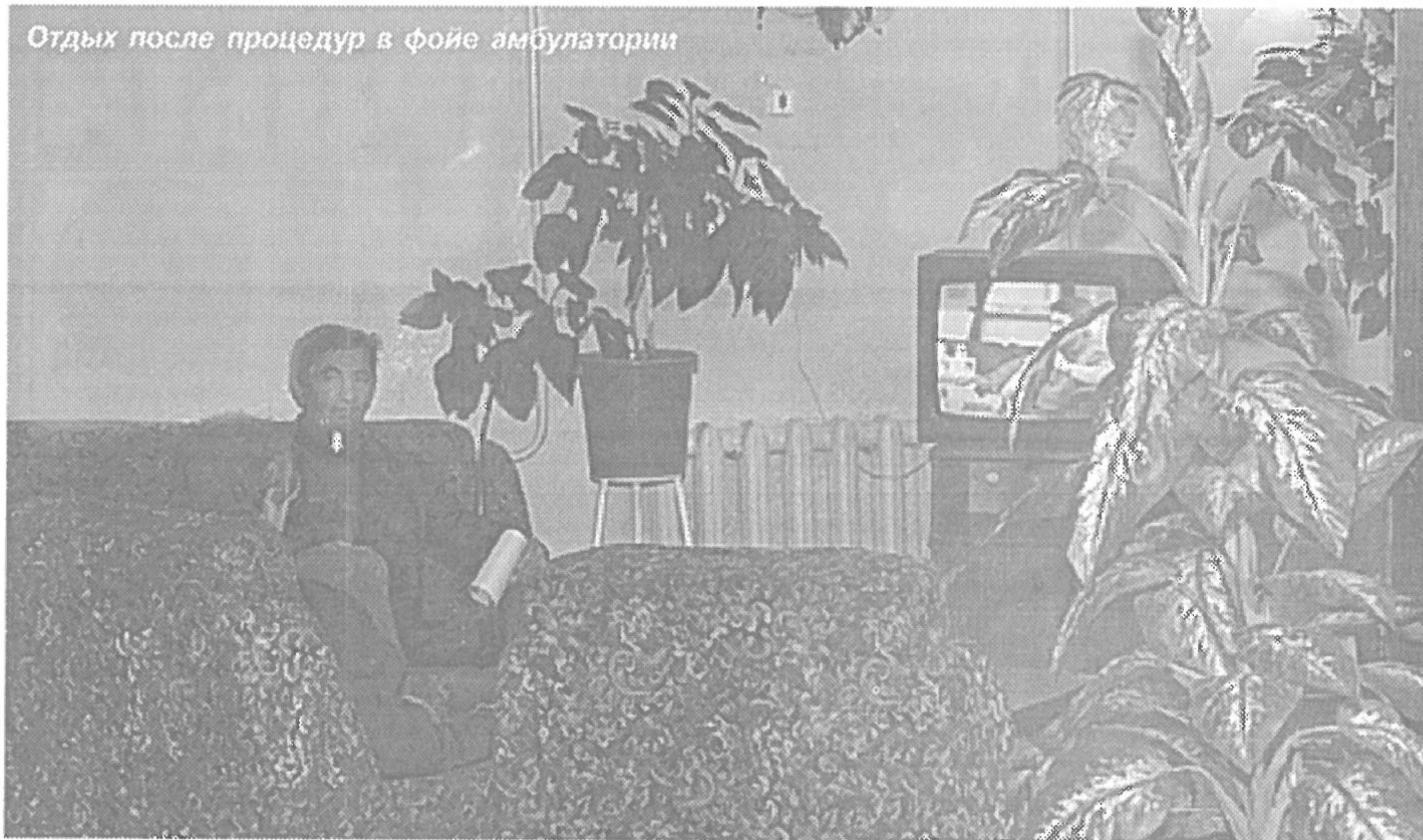
Отдых после процедур в фойе амбулатории