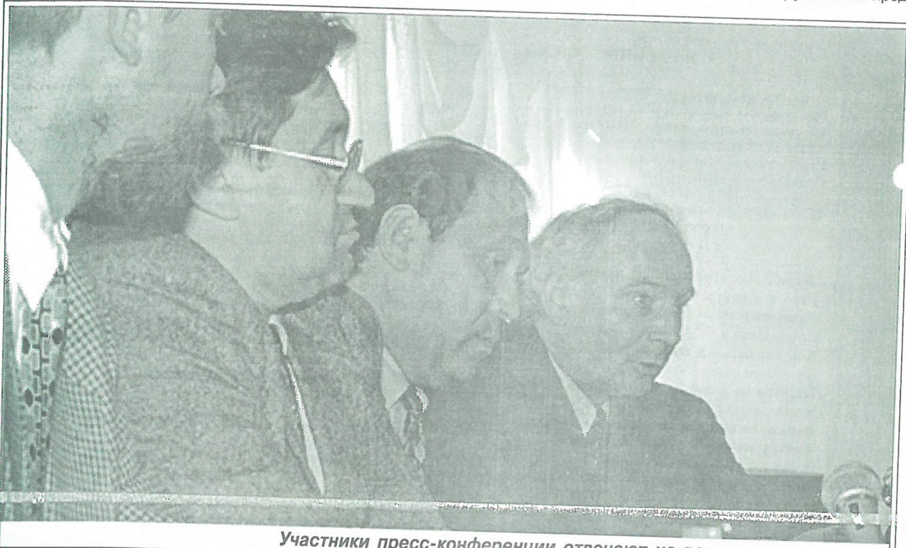
Участники пресс-конференции отвечают на вопросы журналистов

23 мая в г. Салехарде состоялось заседание совета директоров АО “Нефтяная компания “Роснефть”. Было принято решение о посещении делегацией совета директоров Пуровского района с целью ознакомления с работой одного из крупнейших пред-