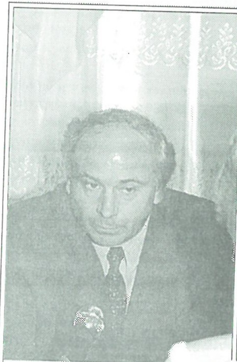
Президент компании “Роснефть” дал высокую оценку деятельности “Пурнефтегаза”

23 мая в г. Салехарде состоялось заседание совета директоров АО “Нефтяная компания “Роснефть”. Было принято решение о посещении делегацией совета директоров Пуровского района с целью ознакомления с работой одного из крупнейших пред-