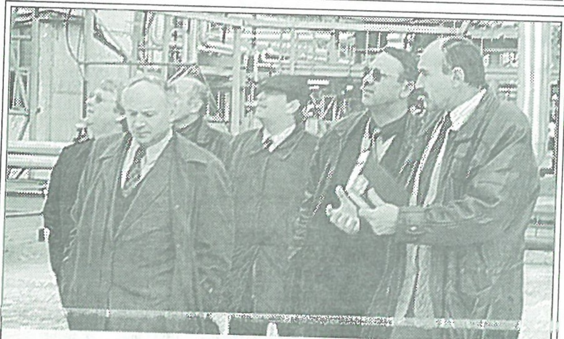
На Тарасовском месторождении