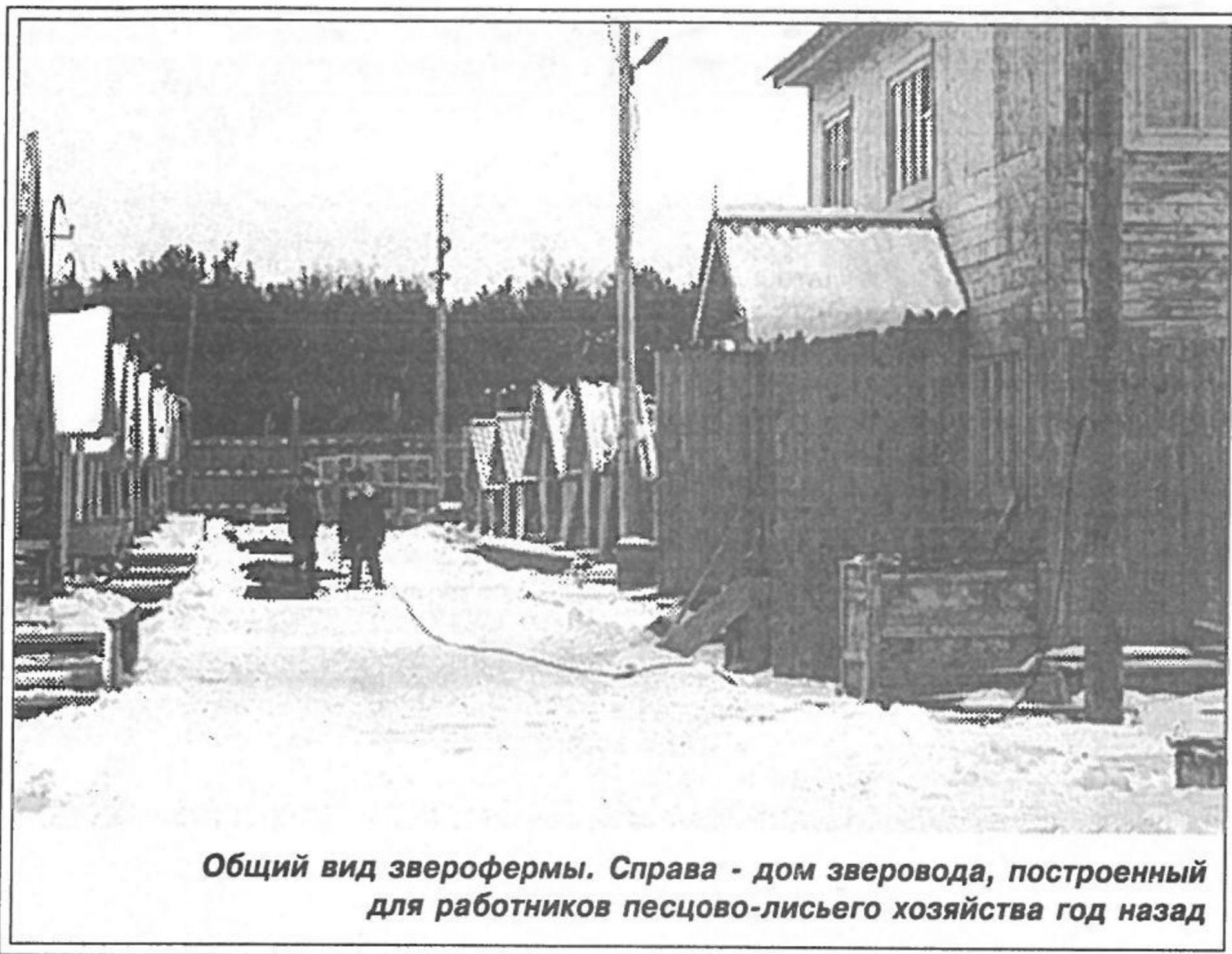
Общий вид зверофермы. Справа - дом зверовода, построенный для работников песцово-лисьего хозяйства год назад

шой болеет за дело: и утром раньше всех здесь, и вечером поздно задерживается, и в выходные приходит”.