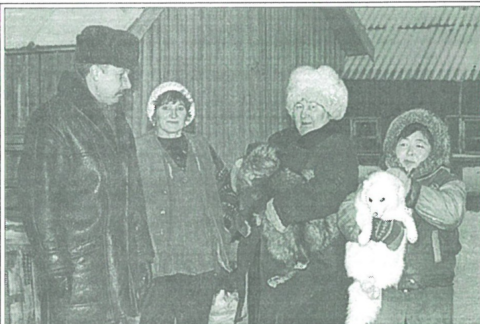
Ноябрь - "горячий" месяц для звероводов. Идет забойка зверей, а это своеобразное подведение итогов. Показатели года неплохие - и количество, и качество пушнины удовлетворяют работников фермы и руководителя хозяйства

На звероферме ТОО "Совхоз "Верхнепуровский" работают 25 человек. Труд зверовода нелегок и по праву считается главенствующим на ферме, но без вспомогательных работ того же подвозчика кормов, кочегара, плотника, сторожа вряд ли удалось бы достичь тех результатов, которыми коллектив сегодня может гордиться. Последние три года, экономически сложные для страны, стали для зверофермы годами развития. На 4 тысячи голов увеличилось хозяйство. Заведующая зве-