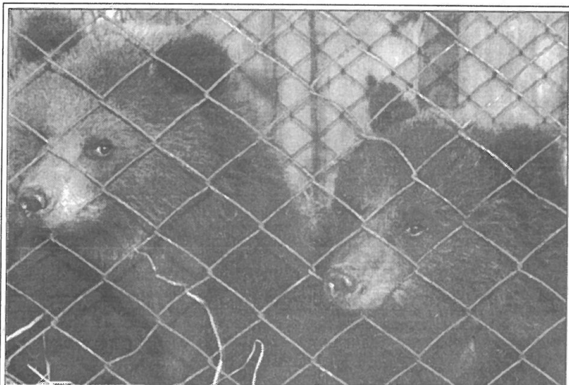
Эти малыши остались без матери, их охотники привезли из леса. А пока талантами будущих артистов не заинтересовался какой-либо цирк, они неплохо живут на звероферме, где к ним уже все привыкли и считают своим зверьем