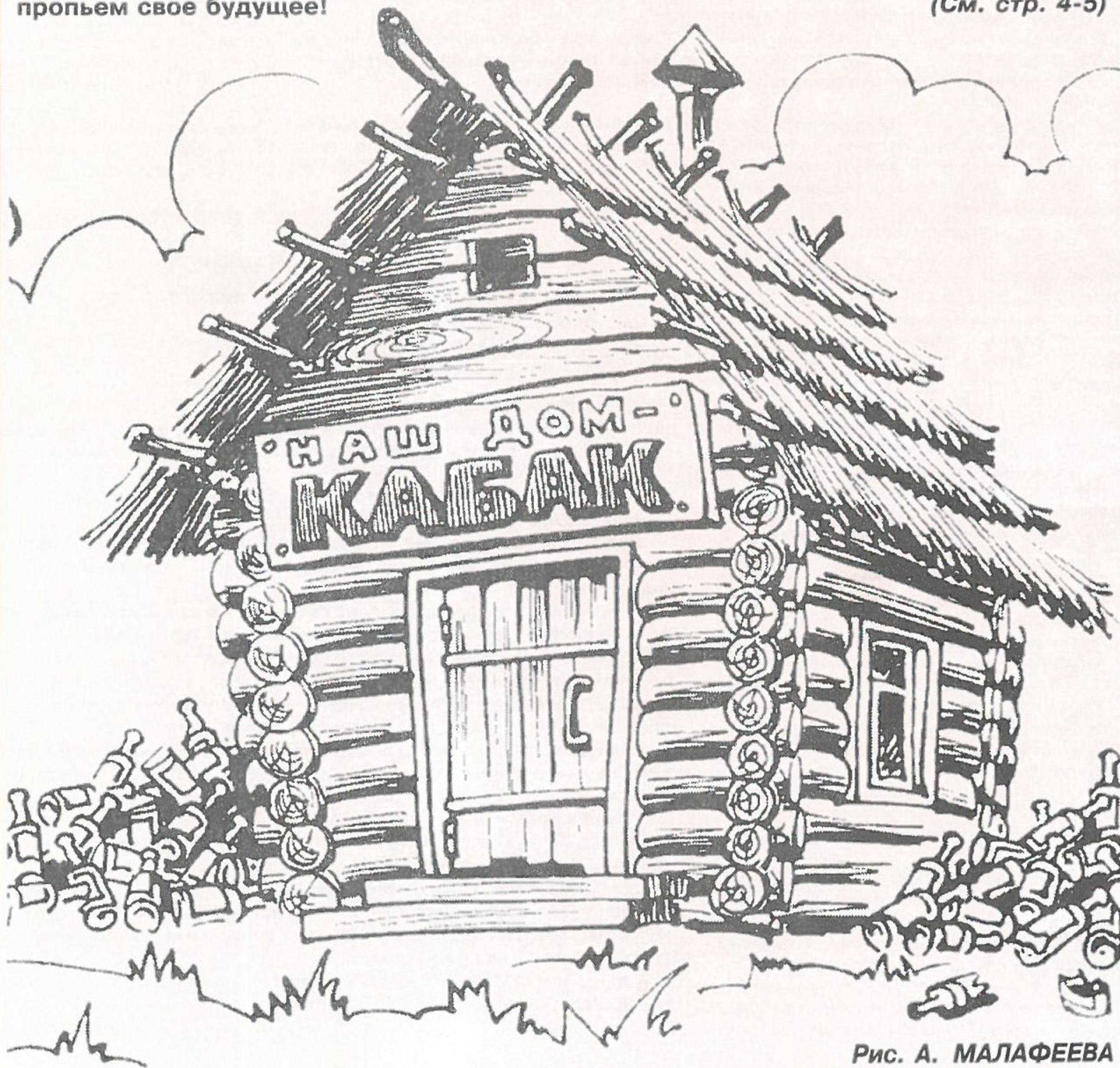
Рис. А. МАЛАФЕЕВА