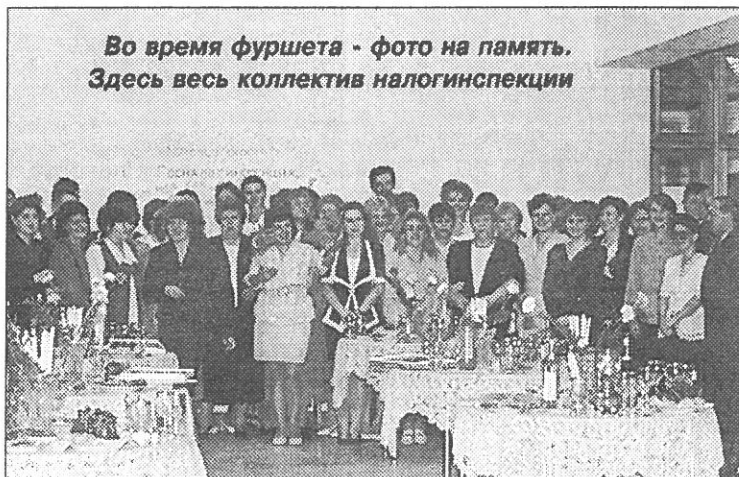
Соб. кор.

Надо сказать, коллектив налоговой инспекции, возглавляемый Н. К. Мелишниковой , основательно под-