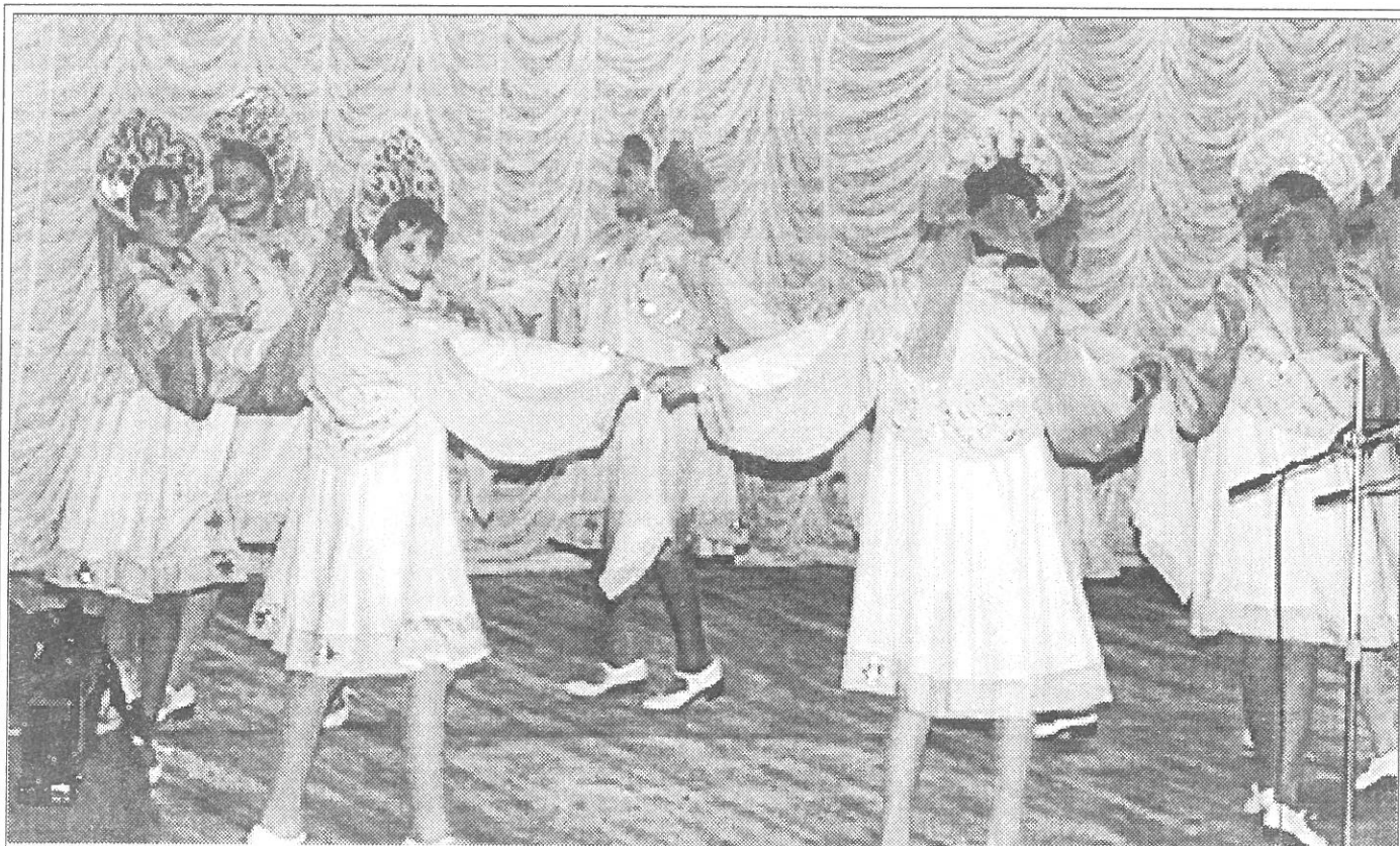
“Зимушка” в исполнении танцевального ансамбля “Северное сияние” (п. Губкинский)