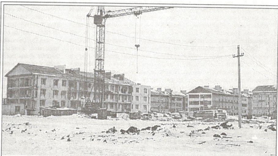
Ханымей строится, Ханымей растет