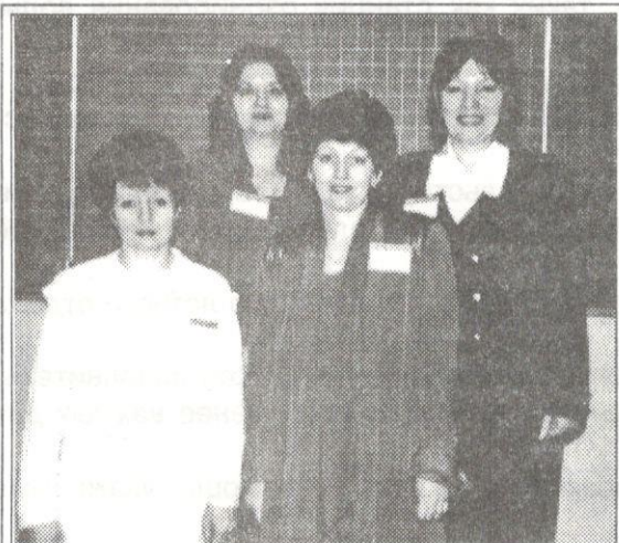
Предметное жюри учителей начальных классов