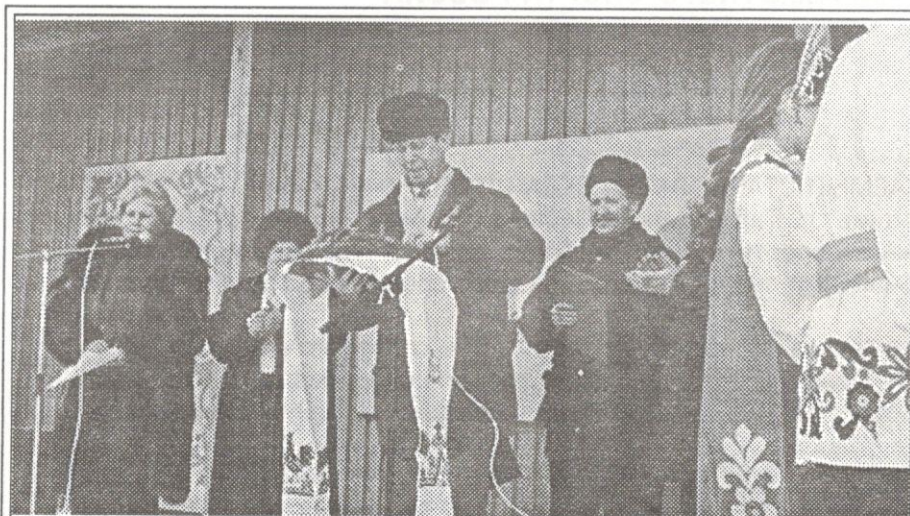
Хлеб-соль дорогим гостям