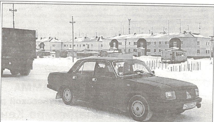
Вместо гусеничных ГТТ по Ханымее сегодня разъезжают "Волги"