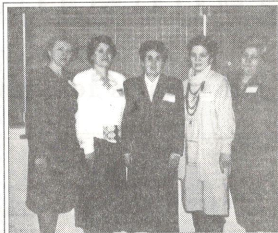
Строго, но не предвзято судило конкурсное жюри