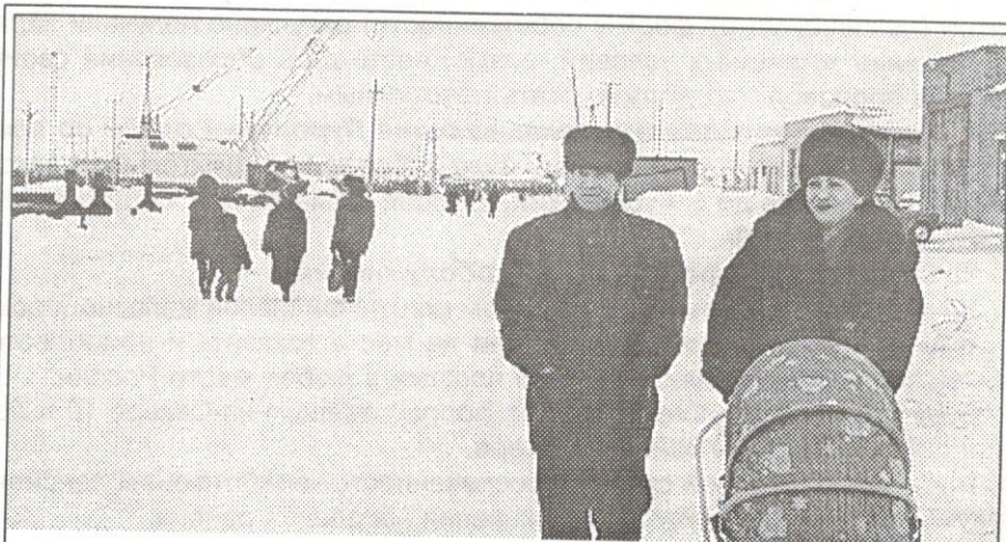
Молодость Ханымей - будущее всего Севера