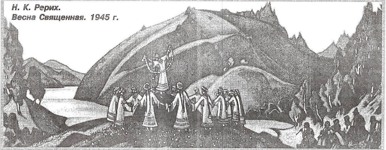
Н. К. Рерих. Весна Священная. 1945 г.

Фонд больницы Святой Ксении разработал мероприятия по созданию здорового образа жизни. Мы будем отмечать людей, являющихся образцами, и ежегодно поощрять их. Это должны быть люди, отличающиеся нравственностью, добротой и обеспечивающие взаимное общение личности и государства. Они должны быть мудрыми, отличаться профессиональным умением. Деятельность их должна быть признана коллективом. Преданность делу имеет значение для следующих поколений людей. Нужны лидеры, которые обеспечат здоровье в следующем веке. Желаю всем счастья и здоровья".