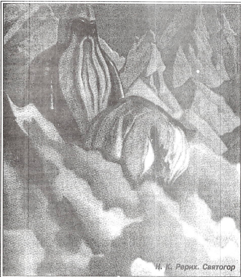
Н. К. Рерих. Святогор

"Конечно, яды древности были очень изысканны; новые изобретения наркотиков сравнительно грубы и главным образом разрушают интеллект".