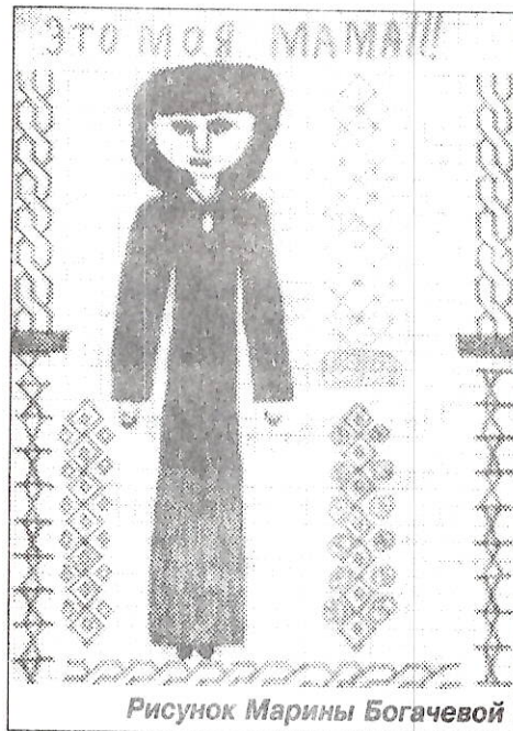
Рисунок Марины Богачевой

нее ответственная должность. Работает мама директором одного предприятия.