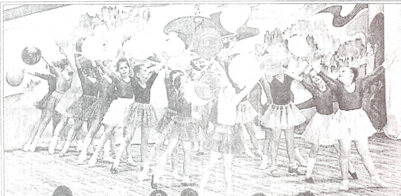
“Волшебный мост” в исполнении подготовительной группы хореографического коллектива завершил праздник танца