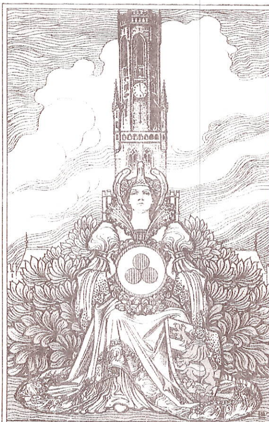
Открытка, выпущенная к III конференции, изображающая Знамя Мира. Брюгге, 1932 год.

С первых дней войны фашисты начали ожесточенно бомбить Смоленск. Однажды ночью бомба попала в музейное здание. Возник пожар, который удалось потушить с большим трудом, пострадали люди. Уже уходили последние эшелоны, а музейный вагон с большим трудом отправили с заводским оборудованием. Там же были картины Крамского, Репина, Врубеля, Серова, Рериха. В вагоне приютились и сотрудники музея. Было очень тесно. Можно было только сидеть или стоять. Спали по очереди на ящиках с экспонатами. Ехали без самых необходимых вещей и одежды, на всех - кулек сахара и несколько десятков сухарей. Мучила жажда. Но сотрудники музея, жгущая со-