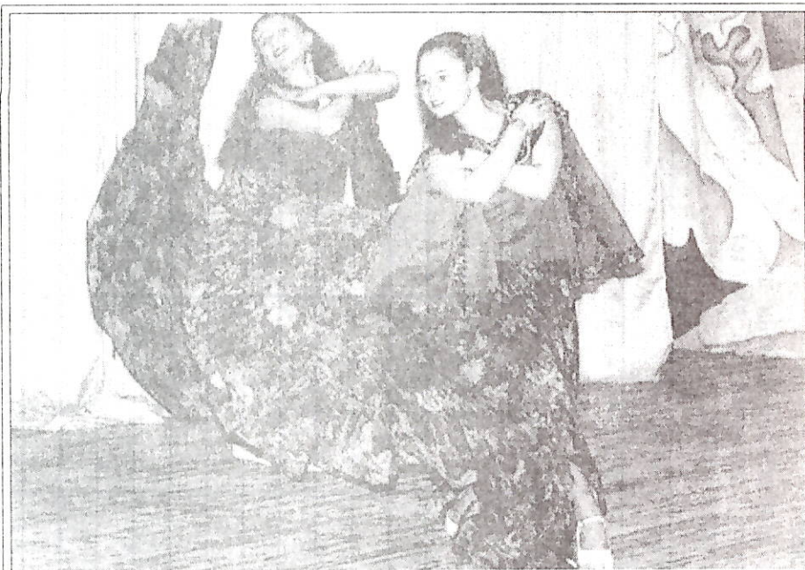
Танец русских цыган “Бричка” сорвал наибольшее количество оваций