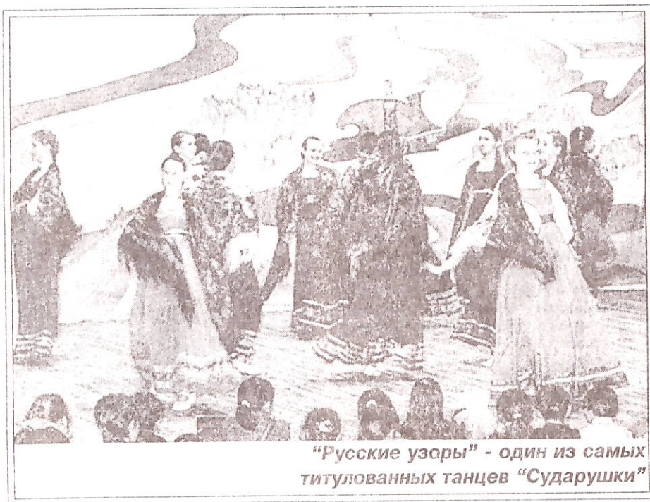
"Русские узоры" - один из самых титулованных танцев "Сударушки"