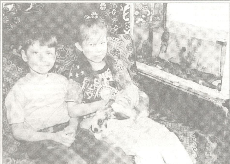
Хорошо вечером посидеть у аквариума. У сестренки и братишки - свои секреты