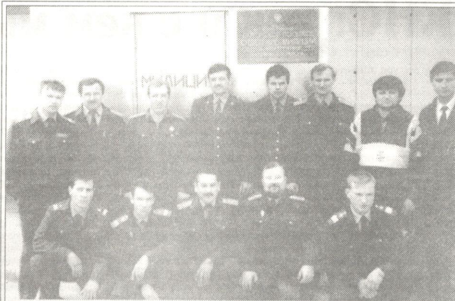
Почти год назад - 1 июня 1997 года - приказом УВД ЯНАО в поселке Пурпе было создано Пурпейское поселковое отделение милиции

По статистике, совершают преступления в п. Пурпе в основном молодые люди в возрасте до 30 лет, ранее судимые, не имею-