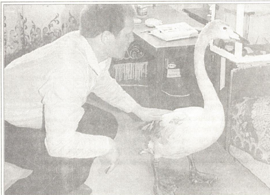
Выкупавшись в первых лужах мая, похорошела белая лебедь Кука

Сонечка принесла семейный фотоальбом и в глазах зарябило. На каждом снимке рядом с домочадцами - живот-