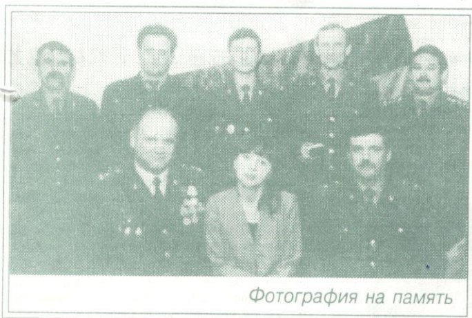
Фотография на память