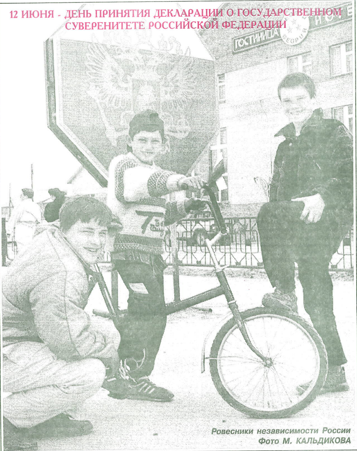
Ровесники независимости России