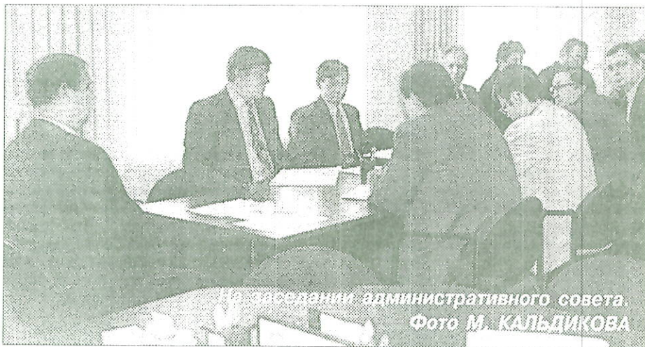
На заседании административного совета.

ПОДБОРКА ПОДГОТОВЛЕНА ПО МАТЕРИАЛАМ АГЕНТСТВА “СЕВЕР-ПРЕСС” И СОБСТВЕННОЙ ИНФОРМАЦИИ