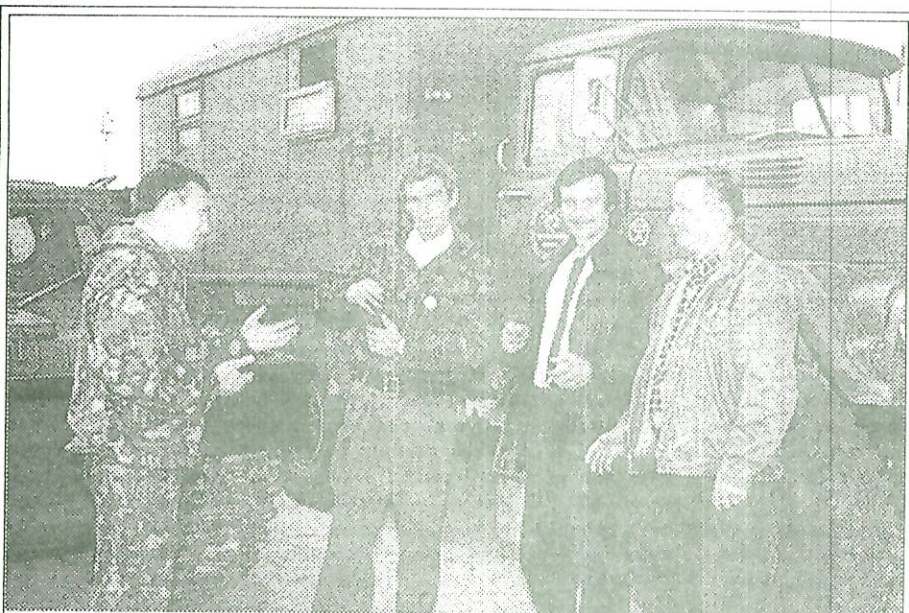
Водители Тарко-Салинского лесхоза. Без них работа лесников сильно затруднена.

- Тарко-Салинский лесхоз был организован в 1978 году согласно приказу Тюменского Управления лесного хозяйства N 168 от 5.07.1976 г. на базе лесов Пуровского и Красноселькупского лесничеств Ямальского лесхоза. На основании письма Министерства лесного хозяйства от 20.03.86 г. в порядке разукрупнения из состава Тарко-Салинского лесхоза выде-