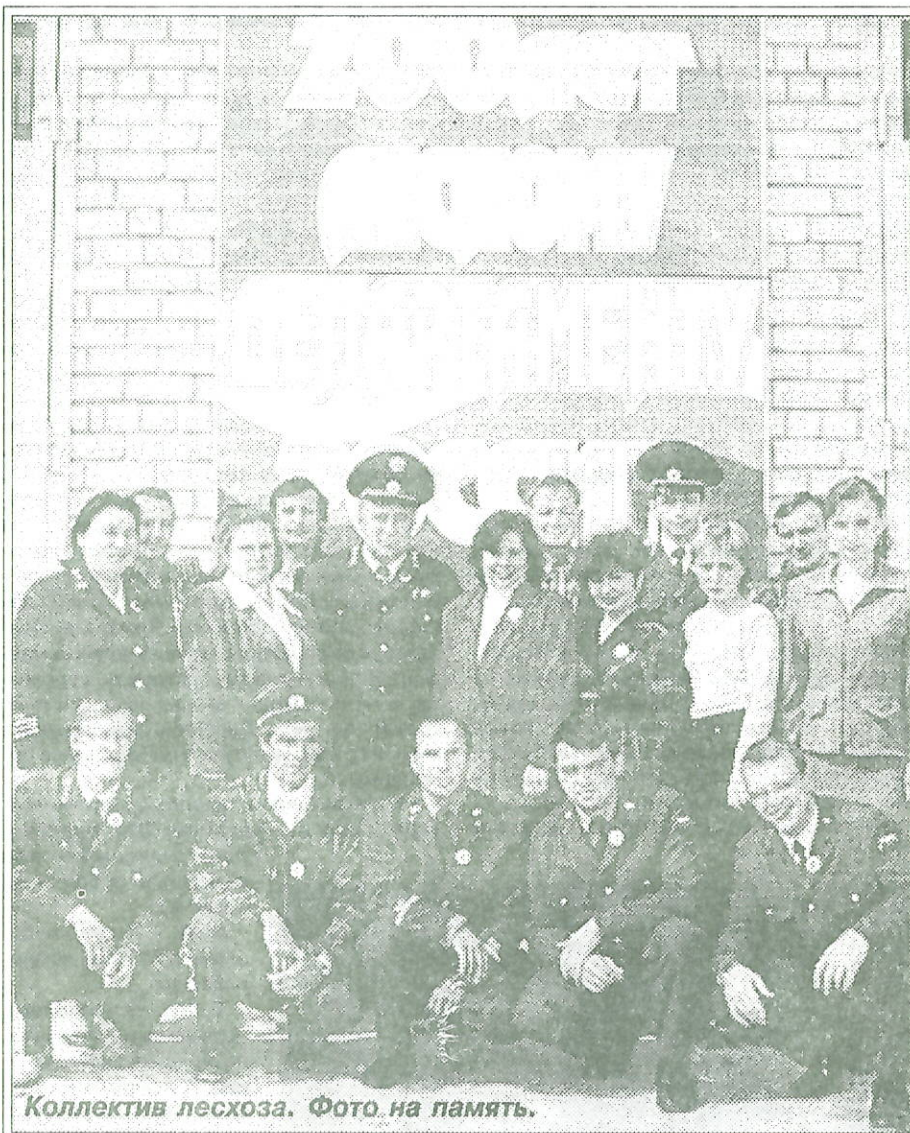
Коллектив лесхоза. Фото на память.

- В целом, конечно же, наблюдается спад в естественном возобновлении лесов. Ежегодно в среднем 500 гектаров площадей становятся абсолютно непригодными для возобновления лесов. Связано это в пер-