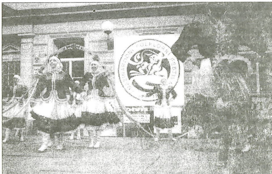
"Сударушка" на фестивальной площадке