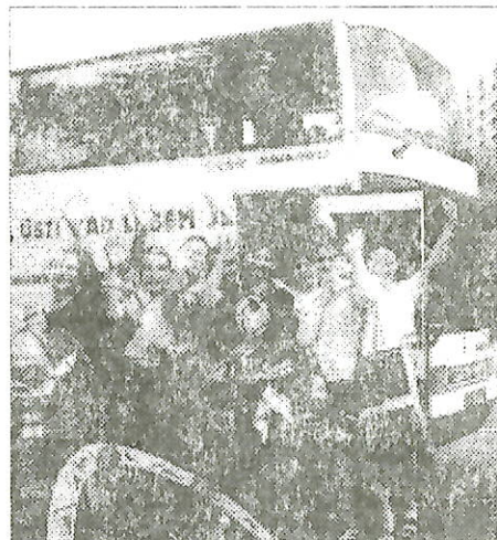
"На экскурсии ездили в двухэтажном автобусе"

Записала И. ИВАНОВА