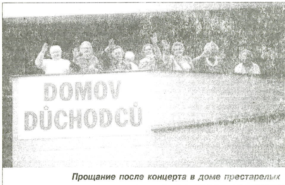
Прощание после концерта в доме престарелых