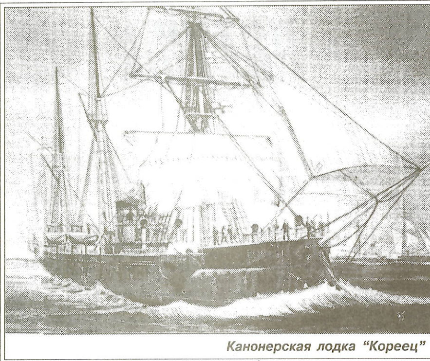
Канонерская лодка “Кореец”

В летопись русской боевой славы золотыми буквами вписаны на века подвиги моряков в дни героической обороны Севастополя 1854-1855 г. подвиги замечательных флотоводцев-руководителей адмиралов В. А. Корнилова, П. С. Нахи-