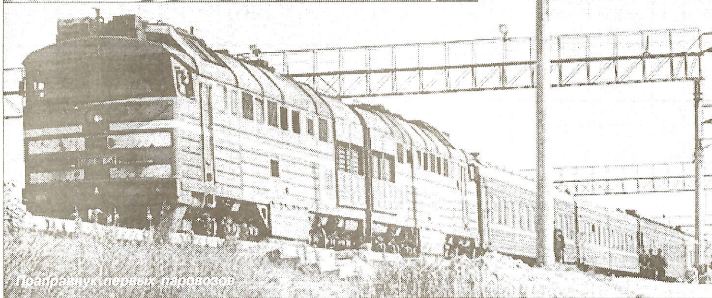
Пассажирский поезд, Пуровск