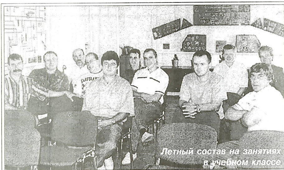
Летный состав на занятиях в учебном классе

- В себестоимость их летного часа также заложено все обслуживание. Когда объемы работ были большими, себестоимость обслуживания растекалась по общему объему полетов и техники и была менее заметной. А сегодня она так удорожила летный час, что без перекаладывания части