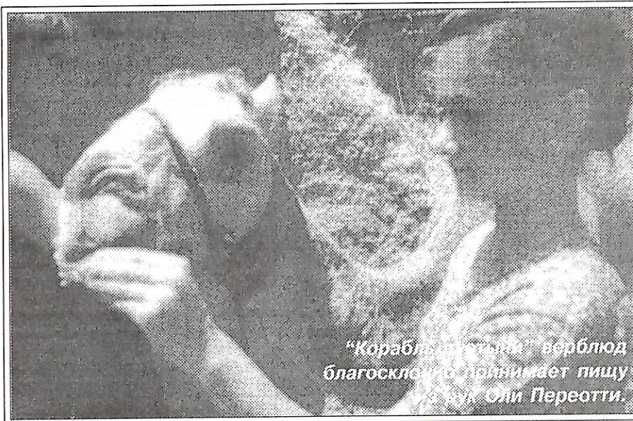
"Корабль «Морошка» верблюды благосклонно принимает пищу" Алла Оли Перестти.