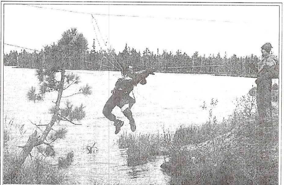
Участок соревнований - навесная канатная переправа

ентироваться на местности, поставить палатку и. т. п. Непростым делом для юных туристов оказалось преодолеть “тарзанку”,