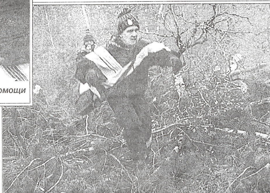
Преодоление лесных завалов