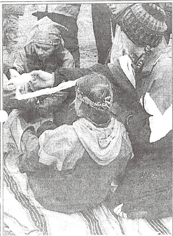
Оказание медицинской помощи

СШ N 2. Первый этап - и сразу же серьезное испытание - навесная переправа через ручей.