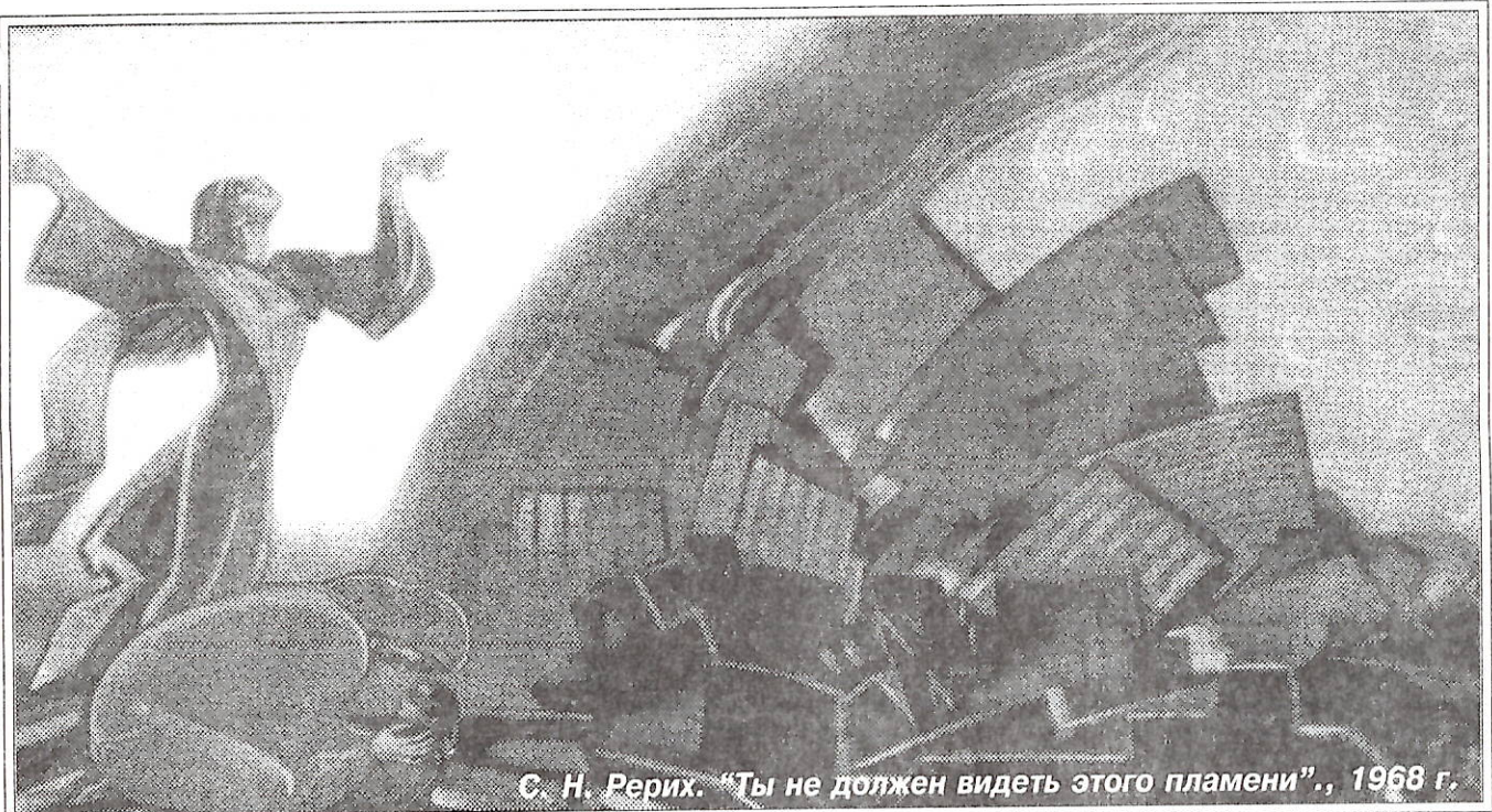
С. Н. Рерих. "Ты не должен видеть этого пламени"., 1968 г.

Сочинения предоставила педагог-валеолог ТССШ №1 П. СИМКИНА