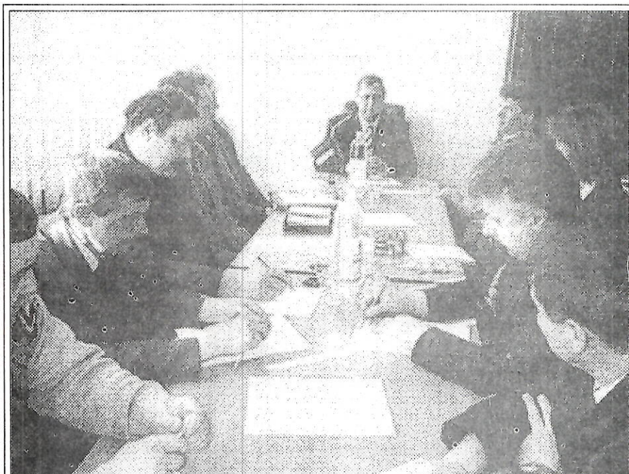
Совещание руководителей предприятий райцентра