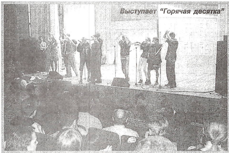
Выступает “Горячая десятка”