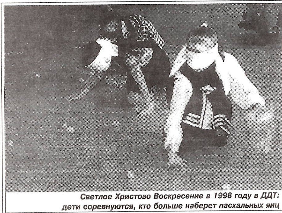
Светлое Христово Воскресение в 1998 году в ДДТ: дети соревнуются, кто больше наберет пасхальных яиц