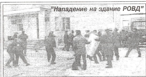
"Нападение на здание РОВД"

В результате проведенных операций проверены: уровень подготовленности личного состава к действиям при возникновении чрезвычайных обстоятельств, достижения слаженности, взаимодействия и взаимозаменяемости в работе подразделений РОВД, отработка схем оповещения, управления и связи, необходимых оперативных документов, изыскание более совершенных путей и спосо-