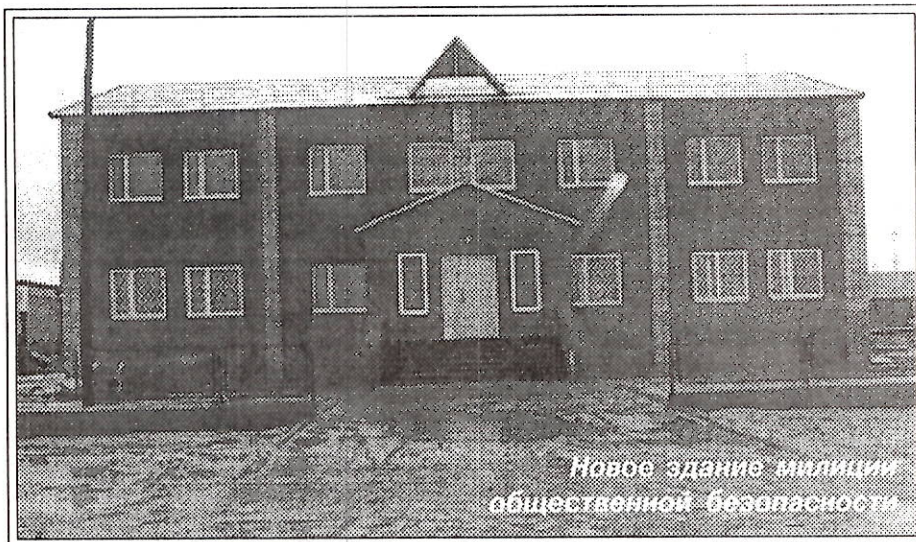
Новое здание милиции общественной безопасности

А путь к этому долгожданному событию был непростым. Несколько лет назад здание РОВД было наполовину уничтожено пожаром. Не хватало кабинетов для работы, но коллектив, переживая критическое время, жил и выполнял возложенные на него обязанности. Шло время, на этом же месте было построено новое здание в капитальном исполнении. Но за этот же период увеличился объем работы и соответственно коллектив. И снова в здании стало тесновато. Благодаря помощи руководства “Таркосалегеоултранс” выход был найден: было выделено несколько рабочих кабинетов для службы ГАИ, что позволило сотрудникам не прерывать ни на день работу с людьми. В 1997 году администрация Пуровского района приняла решение о передаче строившегося на промзоне, на въезде в п. Тарко-Сале, здания, где и было запланировано разместить подразделения