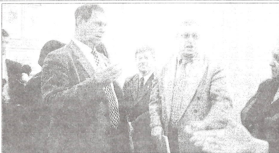
Взрослые участники проекта обсуждают варианты доставки панно в Москву