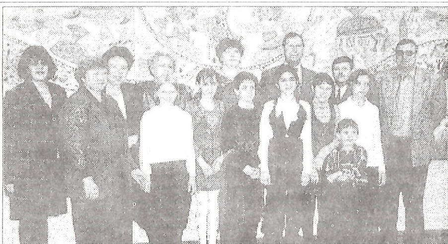
"Хорошо, когда на свете есть друзья!" Фото на память

стантиновой Павленко, раскроют нашу газету и вспомнят, как все было.