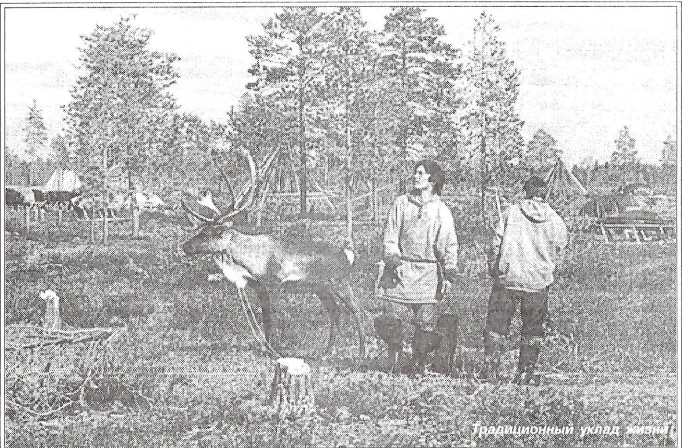
Традиционный уклад жизни