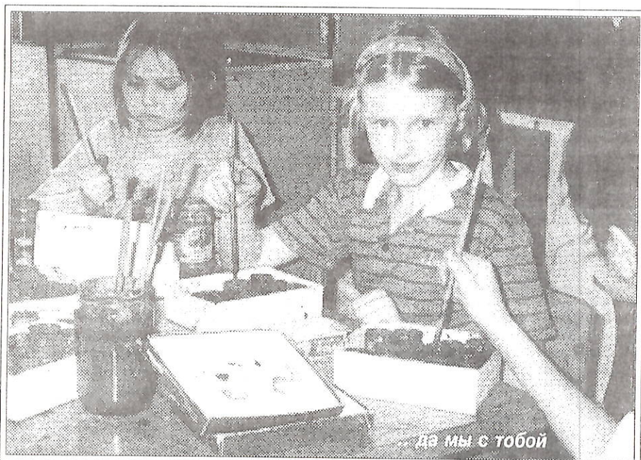
...да мы с тобой

Панно, над которым в конце учебного года трудились ребята из тарко-салинской СШ №1, уже передано в дар Российскому фонду культуры. Наши юные художники принимают участие во Всемирном конкурсе детского художественного творчества под девизом “Взгляд в будущее сквозь призму своей страны”. Об оценке работы пока говорить рано, ведь открытие выставки, намеченное на конец июня, так и не состоялось. Подведение итогов конкурса перенесено на сентябрь из-за того, что не собралось достаточное количество участников. Хотя, надо сказать, Ямало-Ненецкий автономный округ выставил четыре работы: из Нового Уренгоя, Лабытнаног, Губкинского и Тарко-Сале.