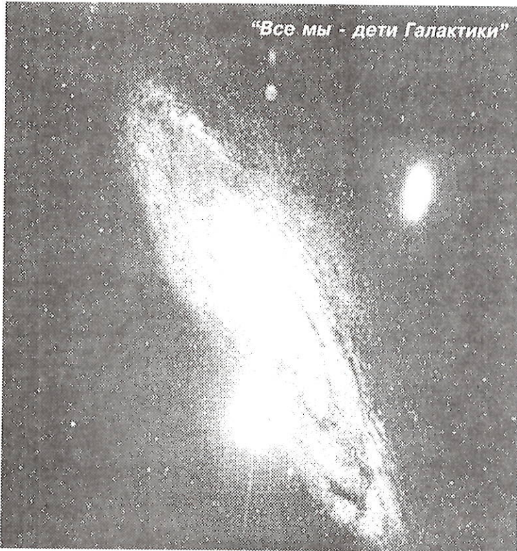
“Все мы - дети Галактики”

“Надо истинную мораль извлечь из естественных начал Вселенной, из ее общих законов и сделать ее таким образом убедительной и приемлемой всеми людьми”