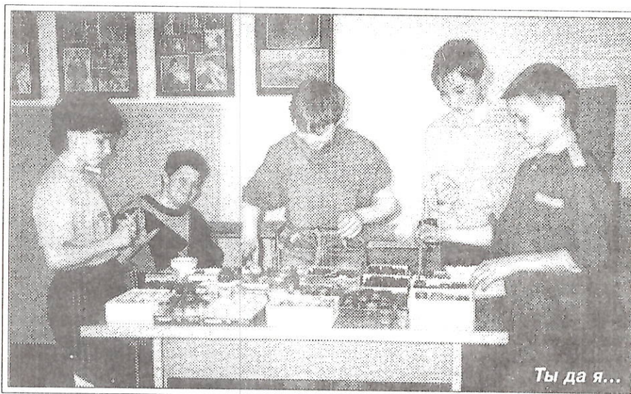
Ты да я...