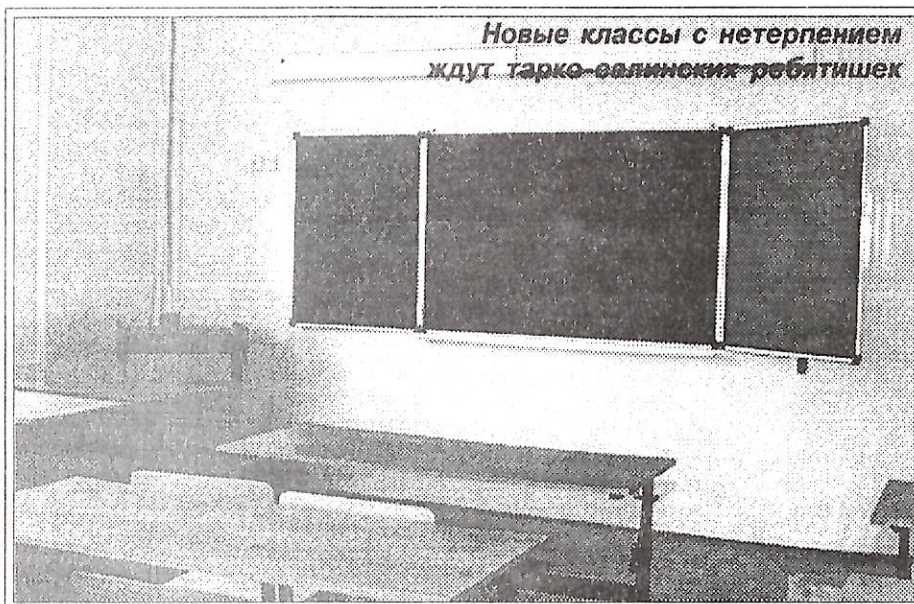
Новые классы с нетерпением ждут тарко-салинских ребятишек