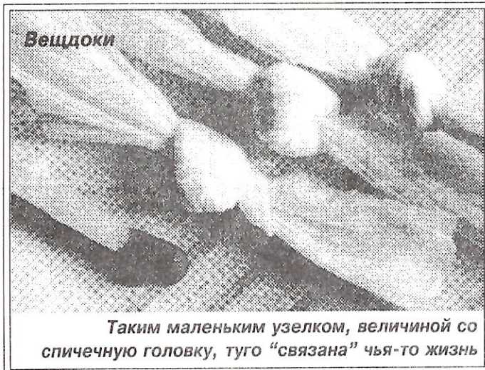
Таким маленьким узелком, величиной со спичечную головку, туго "связана" чья-то жизнь

инспектор по связям со СМИ штаба Пуровского РОВД лейтенант милиции