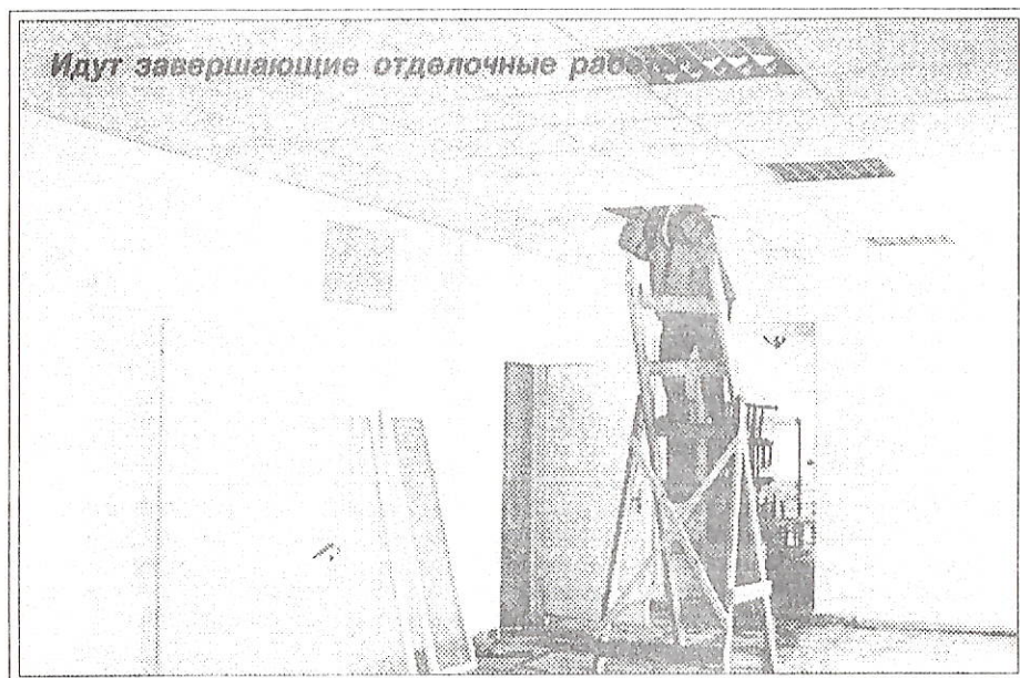
Идут завершающие отделочные работы

им будущими хозяевами, школьники проводят последние дни летних каникул за подготовкой к учебе. Приобретают все необходимое. В этом году в поселке стало заметно проще с приобретением учебной литературы, учебников и канцтоваров благодаря предпринимателям, которые заранее позаботились о школьниках, завезли все необходимое.