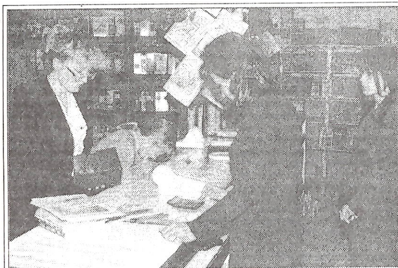
В новом магазине "Школьник", который располагается на рынке "Ямал" п. Тарко-Сале, можно приобрести все необходимое для учебного процесса - от ластика до учебника

Записала С. МАРТЫНОВА , п. Уренгой