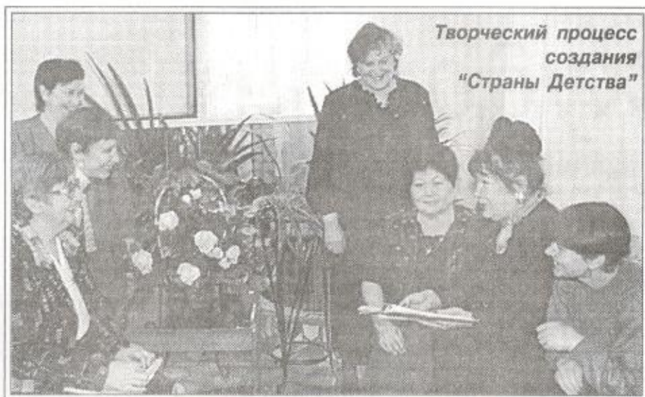
Творческий процесс создания "Страны Детства"