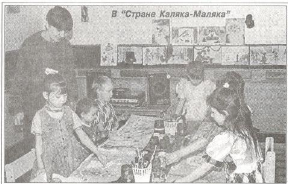
В "Стране Каляка-Малыка"