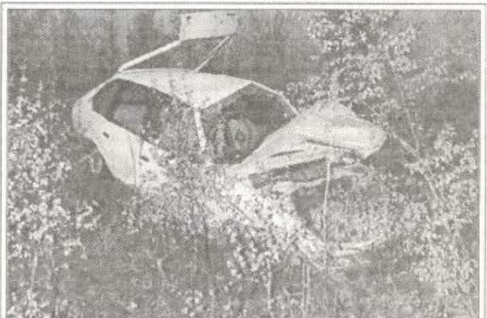
24.06.99 г. пьяный водитель на 4-м км дороги Тарко-Сале - Пуровск превысил скорость и улетел в кювет