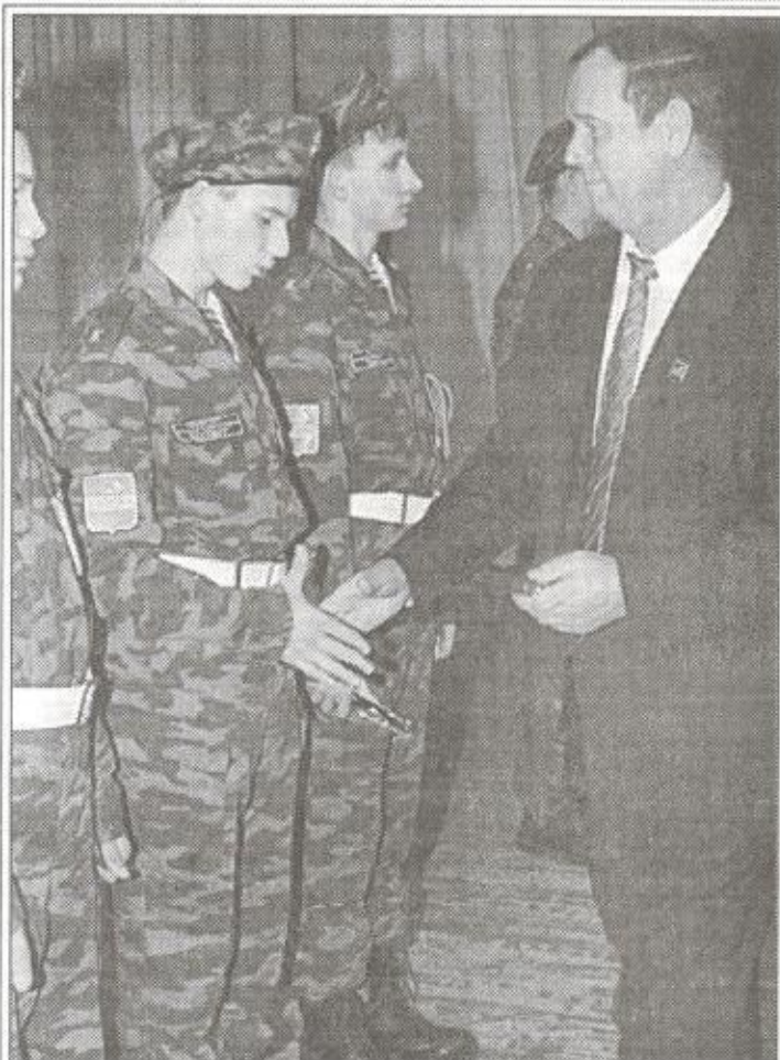
"Командирские" часы будущим командирам в подарок из рук главы района

Гостей курсанты встречали по всем правилам воинского устава, в строю, с громогласным "Здравия желаем". Провели их по школе, представили педагогам, за чаем рассказали о своей жизни, пригласили на вечернее торжество, связанное с принятием торжественного обещания курсанта (что-то сродни воинской присяги). Это произошло в конце дня в КСК "Геолог". После клятвы курсанты показали гостям чему они уже научились за короткое время учебно-службы. Самыми зрелищными, конечно же, были боевые