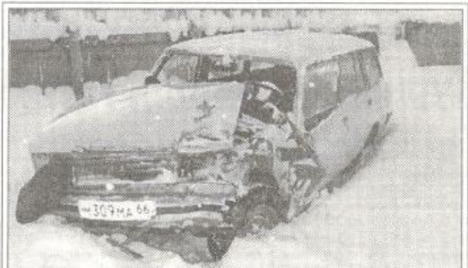
30.11.99 г. водитель этой машины допустил ДТП на объездной дороге около конторы Т-С НГРИС