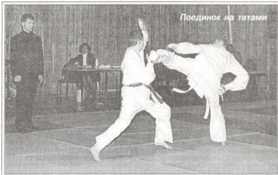
Поединок на татами