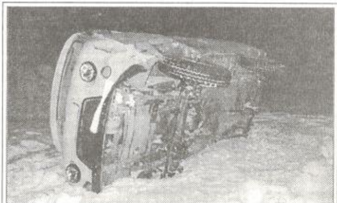
Этот автомобиль был угнан 6.01.2000 г. 14-летним подростком и обнаружен на 12-м км дороги Тарко-Сале - Пуровск

И как результат этого, только иногородним транспортом в 1999 году совершено 25 ДТП, из них 17 - владельцами личного транспорта и 8 - юридическими лицами, в которых 11 человек погибли и 33 были ранены, в том числе на участке, обслуживаемом ГИБДД Губкинского ГОВД произошло 18 ДТП, в которых 8 человек погибли и 29 человек были ранены, то есть за счет этих ДТП допущена тяжесть последствий - из 11 погибших 8 погибли на участке обслуживания Губкинского ГОВД.