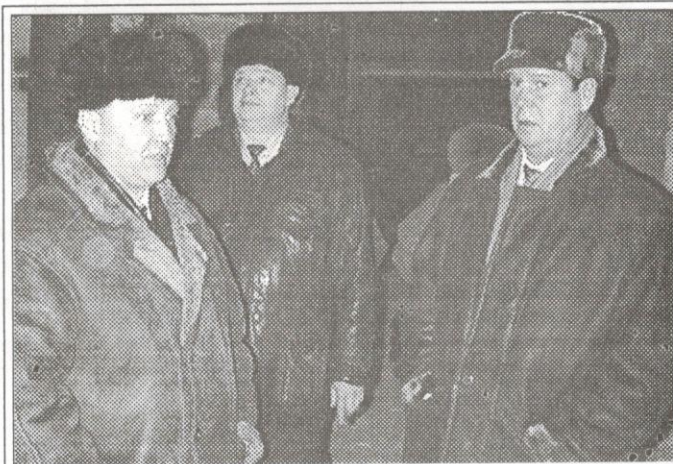
Посещение строящейся школы на 620 мест

служб, пообещал на время оформления документов по созданию заповедника или закрытого ареала обитания издать распоряжение, предусматривающее защиту рыбных водоемов от браконьеров, активизировать работу охранных служб.