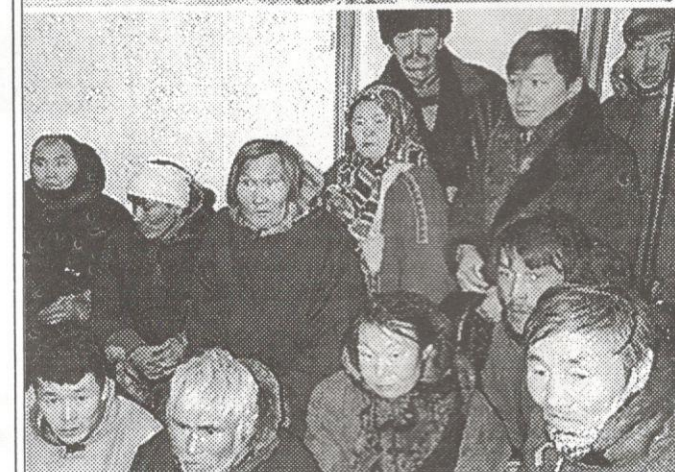
Собрание на фактории “Кара-нат”