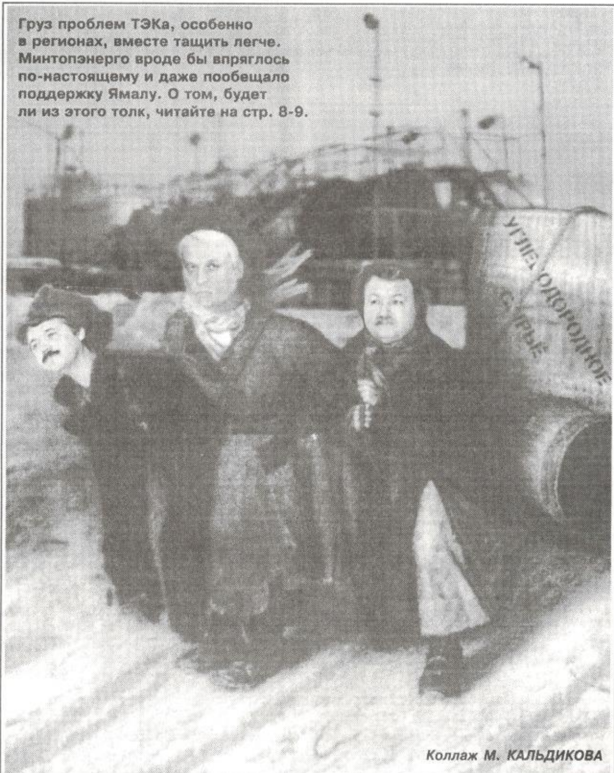
Коллаж М. КАЛЬДИКОВА

Груз проблем ТЭКа, особенно в регионах, вместе тащить легче. Минтопэнерго вроде бы впряглось по-настоящему и даже пообещало поддержку Ямалу. О том, будет ли из этого толк, читайте на стр. 8-9.