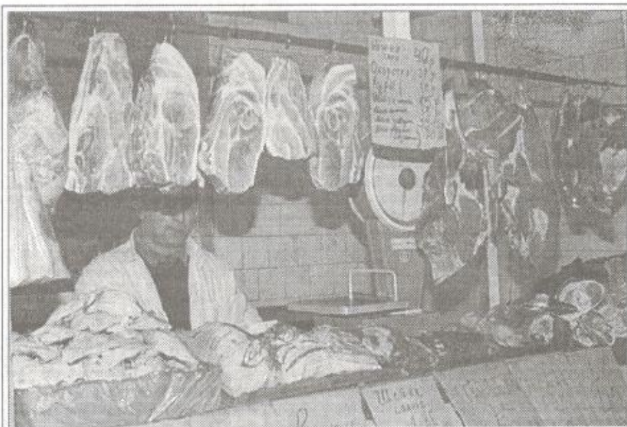
Мясное изобилие на рынке "Ямал"

В соответствии с нынешними нормами Закона, обратившись к продавцу, потребитель должен представить товарный (кассовый) чек либо заменяющий его документ. Однако практика внесла свои коррективы. Уже в 1994 г. в Постановлении Пленума Верховного суда РФ "О практике рассмотрения судами дел по защите прав потребителей" появилась запись о том, что при отсутствии чека потребитель может доказать факт покупки свидетельскими показаниями. Аналогичная норма записана и в ГК РФ, а теперь - и в Законе РФ "О защите прав потребителей". Отныне отсутствие товарного или кассового чека не может быть основанием для отказа в удовлетворении требований потребителя. В то же время продавец вправе потребовать от потребителя предоставления каких-либо иных доказательств приобретения товара именно у него.