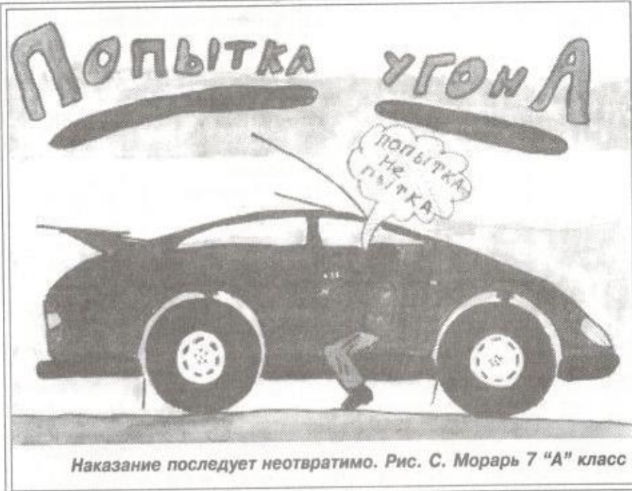
Наказание последует неотвратимо.