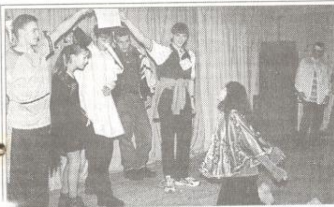
Кто в тереме живет?