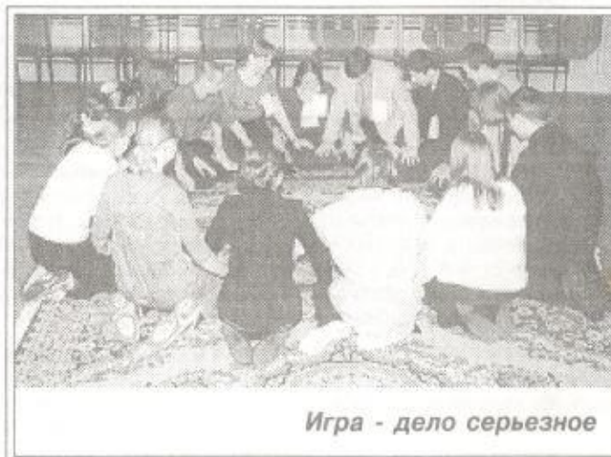
Игра - дело серьезное

Все! Можно друженько идти на лекции. Уроки почти как в школе, только по 30 минут. Учиться было не лень даже в воскресенье - ведь в школе таких уроков не бывает. Экзамен состоялся после обеда. Команды защищали проекты программ