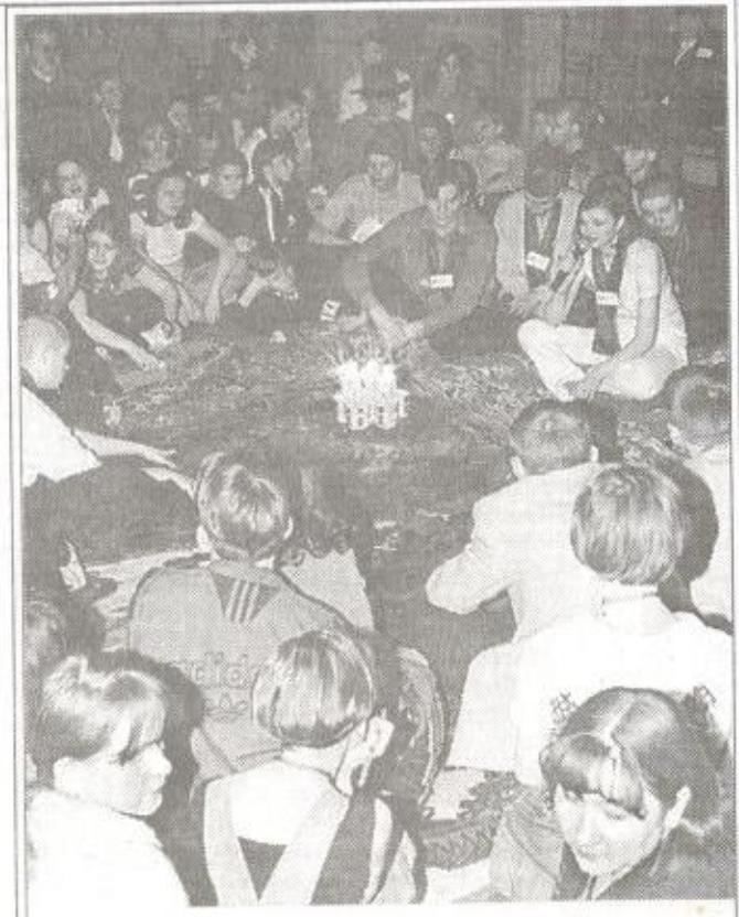
"Свеча". "Академия", успеха!