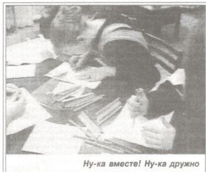
Ну-ка вместе! Ну-ка дружно