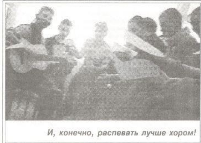
И, конечно, распевать лучше хором!