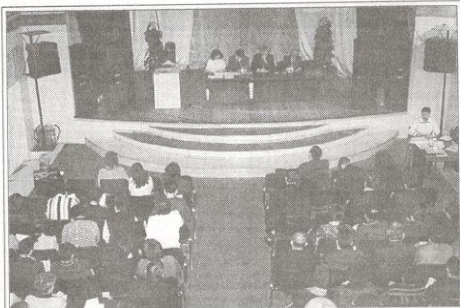
Идет заседание конференции