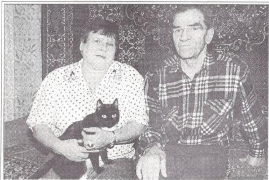
День сегодняшний. В семейной обстановке.