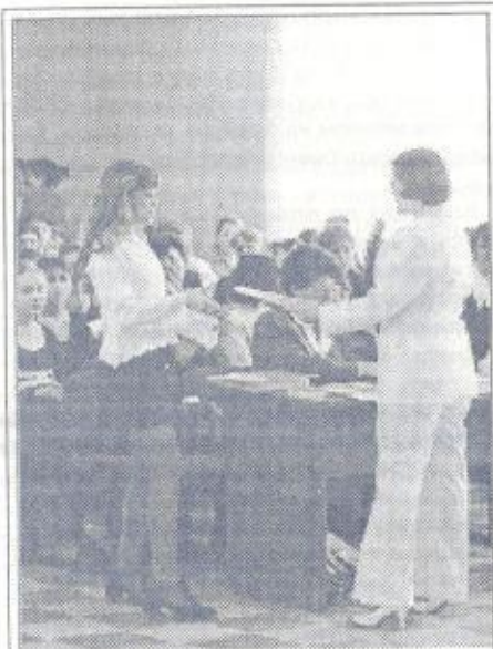
Получают награды активисты