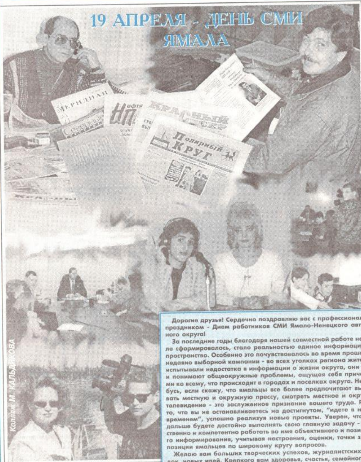
Коллаж М. Кальдикова

Дорогие друзья! Сердечно поздравляю вас с профессиональным праздником - Днем работников СМИ Ямало-Ненецкого автономного округа!