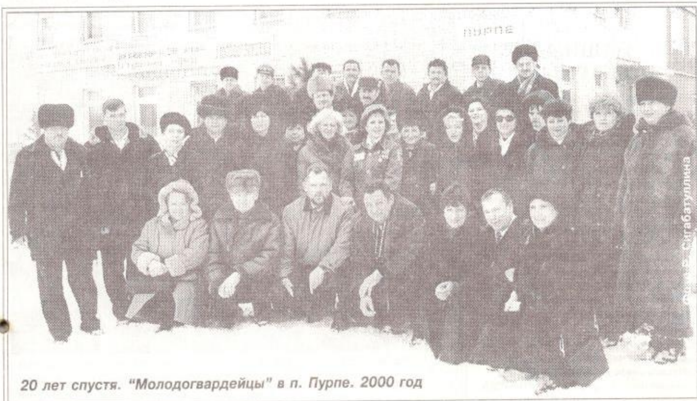
20 лет спустя. "Молодогвардейцы" в п. Пурпе. 2000 год