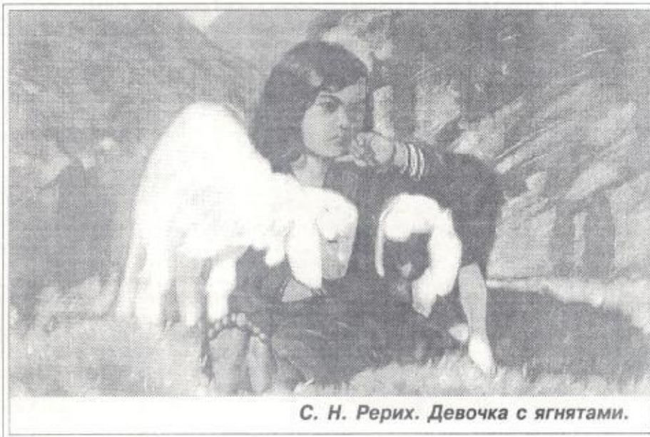
С. Н. Рерих. Девочка с ягнтями.

На уроках ставится вопрос: каким быть? Что я за человек и каким человеком хочу стать. Обсуждаем: что такое добро и зло, что значит быть человеком, формируем отношение к высшим принципам и к самим себе, к людям, к окружающему миру. Рассуждаем о том, что такое нравственность, духовное здоровье. Что определяет ценность человека? - Творчество. Птицы летят по определенному маршруту, строят одинаковые гнезда, делают остановки в определенных местах. Свободно размышлять и принимать решения может только человек. Существуют определенные законы бытия, которые либо способствуют нашему духовному росту, либо, наоборот, приводят к деградации личности. Что бы мы ни думали по этому поводу, эти законы не являются произвольными общественными условностями. Наши попытки изменить их или установить свои собственные законы не менее наивны, чем стремление изменить законы физики. Мы будем ощущать свою духовную целостность только при соблюдении определенных нравственных принципов - законов духовной реальности. Сократ го-