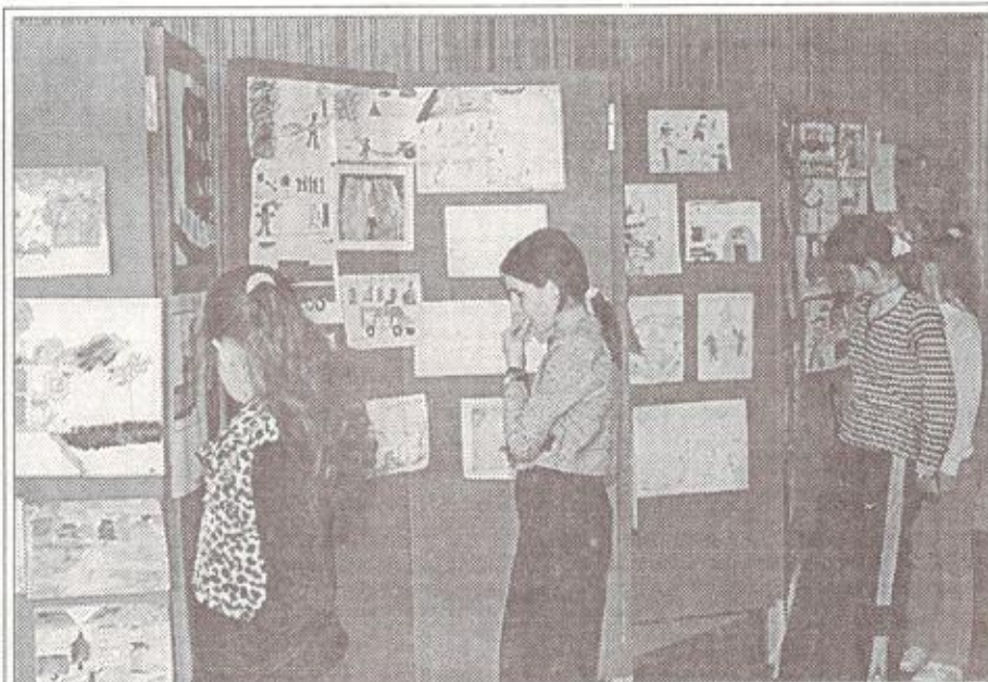
На выставке рисунков, прикладного творчества и письменных работ детей, посвященной пожарным, в Доме детского творчества п. Тарко-Сале