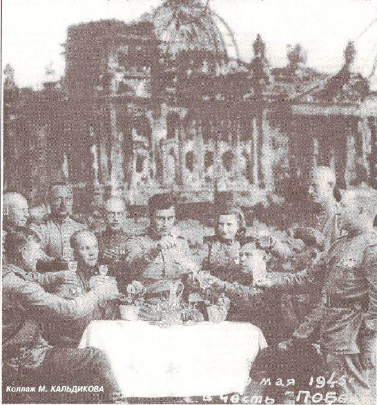
Коллаж М. КАЛЬДИКОВА