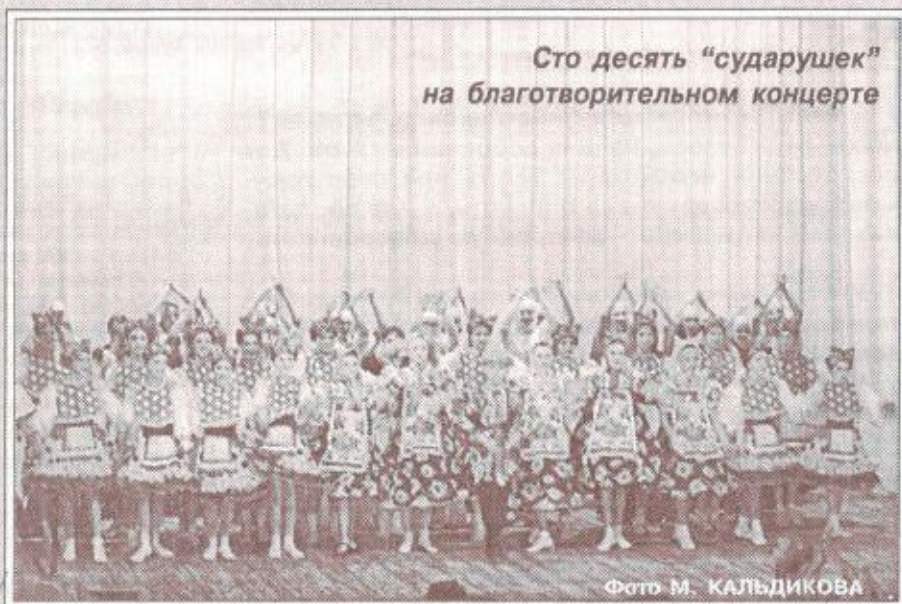
Сто десять "сударушек" на благотворительном концерте