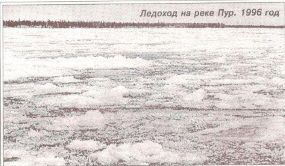
Ледоход на реке Пур. 1996 год

По данным Ямало-Ненецкого гидрометцентра, прогноз вскрытия реки Пур был таков: в районе Тарко-Сале - 27 мая, в районе поселка Уренгой - 29 мая. Однако, по последним сообщениям, вскрытие рек Надым, Пур и Таз ожидается на 10-15 дней раньше срока. Уровень подъема воды в этом году возможен до 920-990 см. Организовано дежурство ответственных лиц администрации на всех диспетчерских постах предприятий, обеспечивающих жизнедеятельность поселка. С ПГЭ составлен договор и смета расходов на проведение взрывных работ для ликвидации ледовых затворов. Заключен договор с авиакомпанией "Ямал" на проведение разведывательных полетов и взрывных работ. Достигнута договоренность с таркосалинским филиалом РГП ОВД "Тюменьаэроконтроль" об