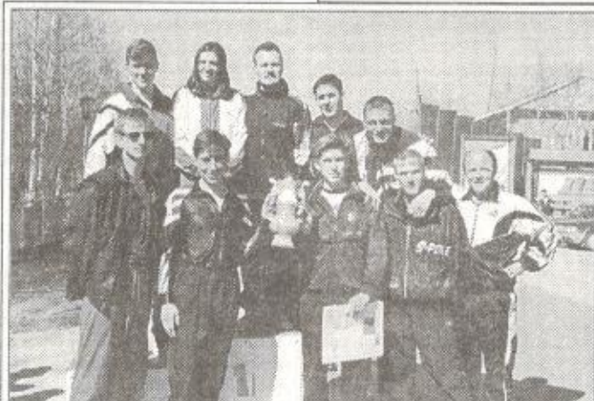
Команда РОВД - победитель эстафеты

ба усилилась, когда на беговую дорожку вышли взрослые. Лидеры менялись на каждом этапе эстафеты. На финише болельщики и судьи наблюдали состязание бегунов из команд РОВД, сборной Пуровского района по национальным видам спорта и районного комитета образования. С отрывом в 6 сек. первой финишировал представитель милиции.