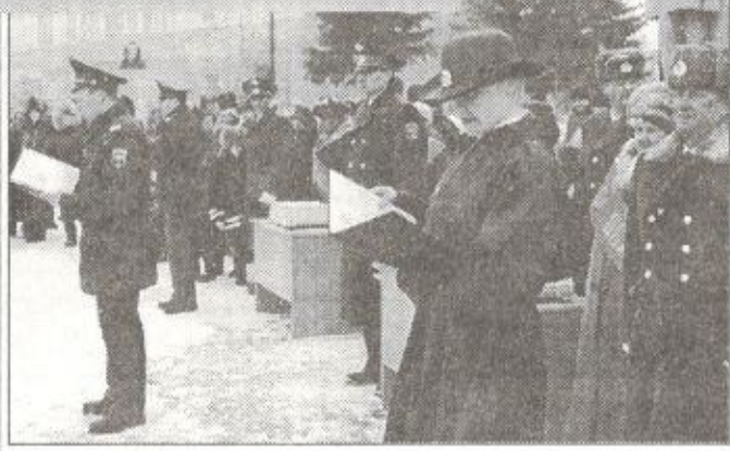
Зачитывается текст присяги

П. ДОРНИН, заместитель начальника РОВД, начальник ОК, капитан милиции