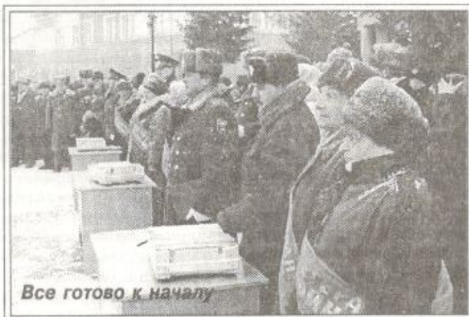
Все готово к началу