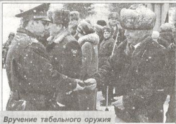
Вручение табельного оружия