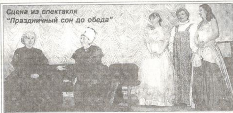
Сцена из спектакля “Праздничный сон до обеда”