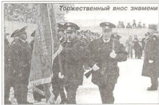
Торжественный внос знамени