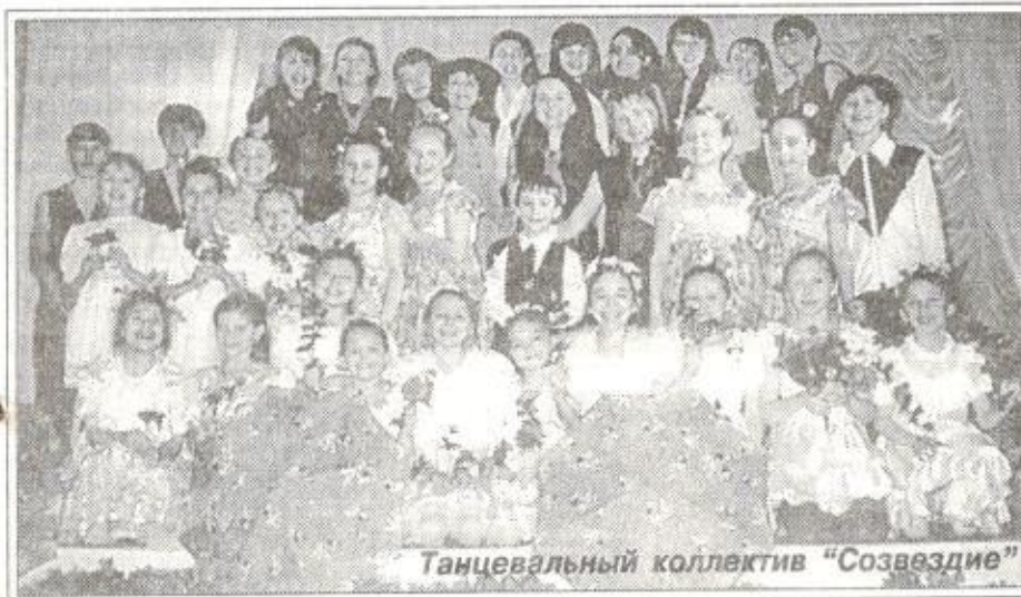
Танцевальный коллектив "Созвездие"

"После "Живи и помни" было очень нелегко прочувствовать роли этого спектакля. Наши актеры сначала очень стеснялись по сути пьесы-комедии, рассказывающей об анекдотических похождениях Бальзамина в поисках богатой невесты, его бессмысленных мечтах о больша-