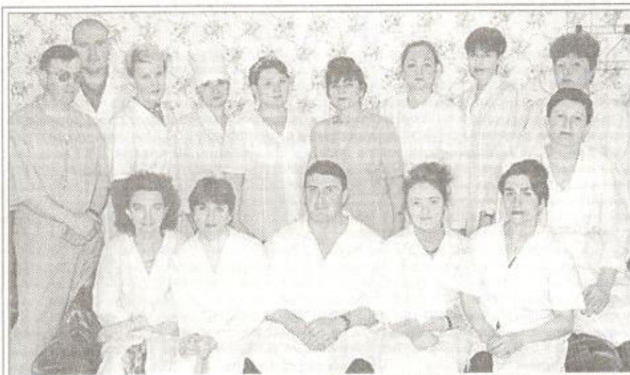
Коллектив хирургического отделения центральной районной больницы