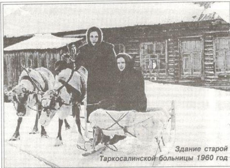
Здание старой Таркосалинской больницы 1960 год