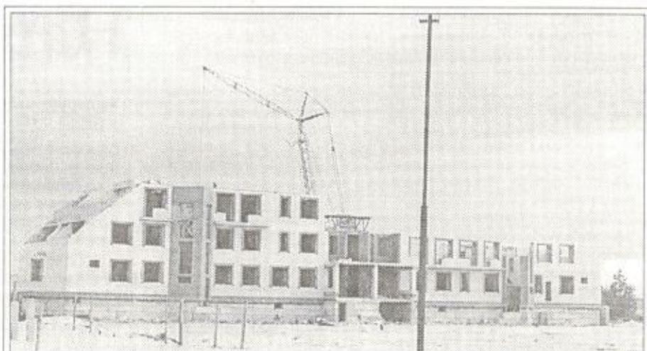
Из окон пансионата-профилактория открывается вид на набережную, где разместятся летние кафе и детская площадка

— Как я уже говорил, на следующий год запланировано реализовать проект размещения геологического музея и Дома детского творчества, достроить школу на 640 мест и хоккейный корт, хотя бы начать строительство школы искусств. Кроме того, на набережной планируется поставить два летних кафе, одно из них будет детским. Ну а дальше, скажем так, мечтается о новом торговом центре на месте бывшей автостоянки, где разместятся 30 магазинов и крытый рынок. А автостоянку мы уже перенесли к светофору (угол Республики и Тарасова).