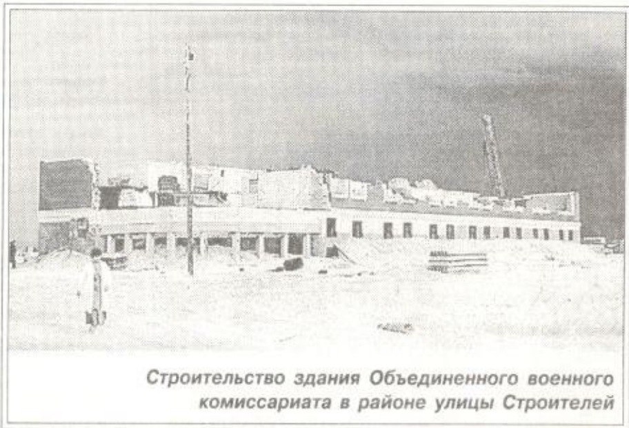
Строительство здания Объединенного военного комиссариата в районе улицы Строителей

Р. С. Редакция "СЛ" присоединяется к поздравлениям и желает архитекторам, строителям, работникам строительной индустрии новых возможностей в реализации богатейшего потенциала отрасли, радости созидания, доброго здоровья, достатка и благополучия в семьях! С праздником!