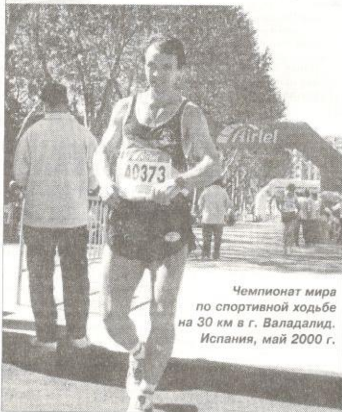
Чемпионат мира по спортивной ходьбе на 30 км в г. Валадалид. Испания, май 2000 г.