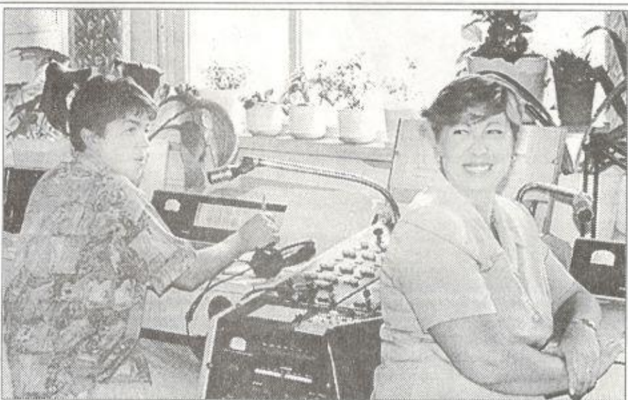
В канун профессионального праздника редакция "СЛ" поздравляет коллектив сотрудников филиала и их семьи с Днем Воздушного Флота России.

Таркосалинский филиал РГП и ОВД "Тюменьавиаконтроль" на сегодняшний день, пожалуй, самое стабильное предприятие авиации из базирующихся в районе.