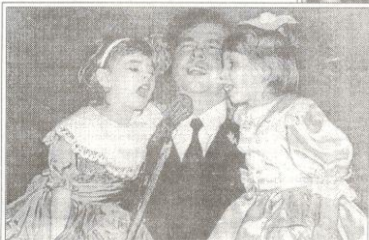
На руках у папы и дедушки - самые юные участницы ансамбля

уже есть официальное признание - диплом лауреата Всероссийского фестиваля семейного художественного творчества.