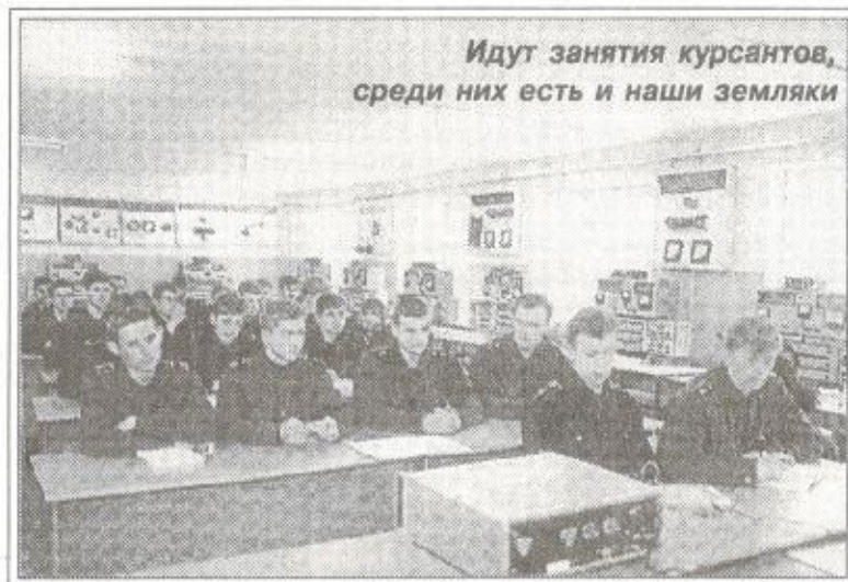
Идут занятия курсантов, среди них есть и наши земляки

(Материал о семье Хороших читайте на стр. 10)