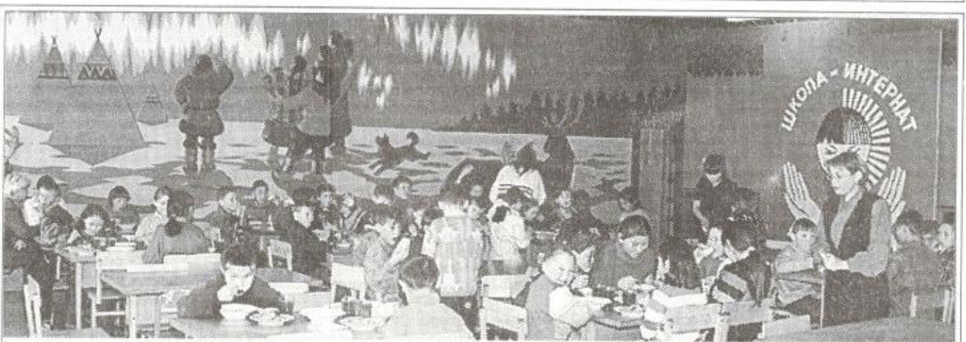
Во время обеда в столовой интерната