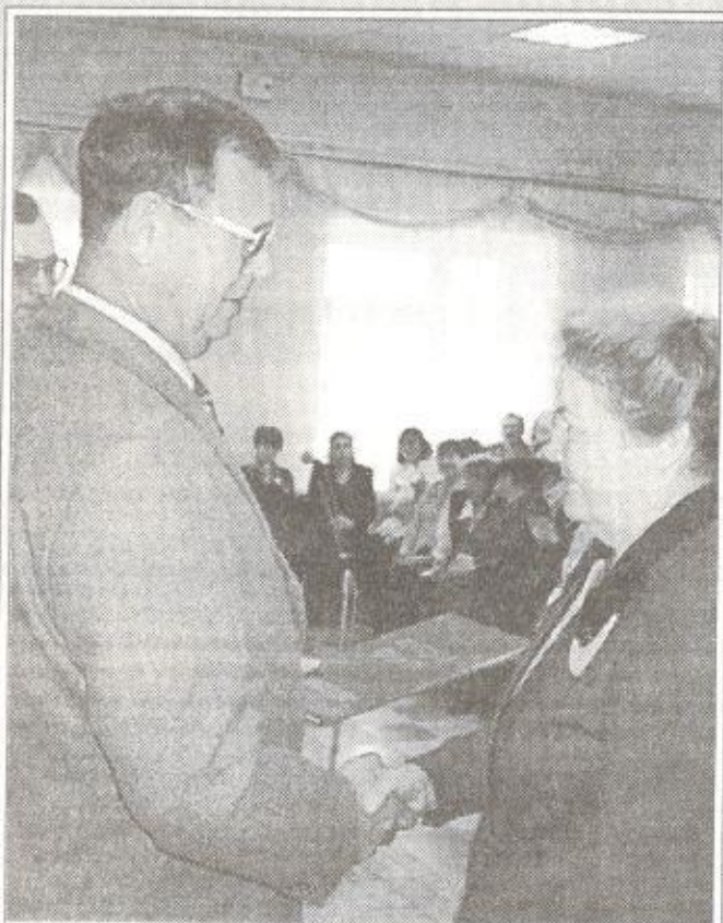
Глава района вручает грамоты педагогам