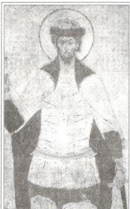
Икона Святого благочестивого великого князя Андрея Боголюбского

В течение первых шести лет своего княжения Андрей построил восемь каменных храмов, среди которых храм Пресвятой Богородицы в Боголюбове, Владимирский Успенский собор и церковь на Золотых воротах во Владимире. Всего великим князем было выстроено более 30 храмов. В конце XX века мы с удивлением и восхищением останавливаемся при виде этих прекрасных творений древних зодчих, хотя они с течением времен и событиями лишились почти всех своих богатств. Что же должен был чувствовать язычник, никогда не видевший ни палат, ни дворцов, ни храмов, молившийся под открытым небом! Несомненно, он убеждался в превосходстве христианской религии. Христианство быстро распространялось и становилось государственной религией, чем сама собой достигалась и политическая цель - сплотить в один народ разноплеменную Русь.