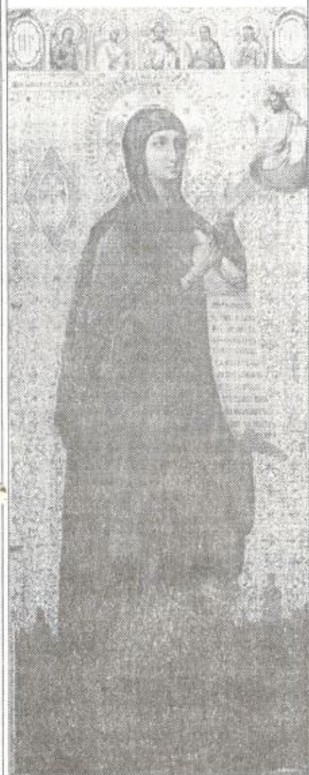
Боголюбивая икона Божией Матери

14 октября - Покров Пресвятой Богородицы