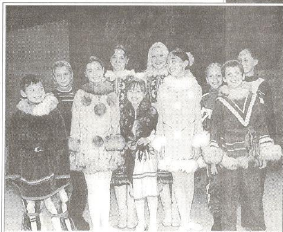
Сборная ЦНК готова демонстрировать свои таланты