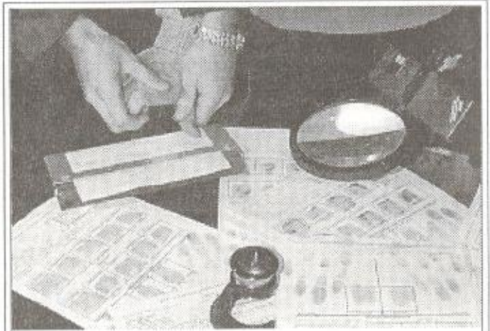
Именно такую процедуру желательно пройти всем пуровчанам от мала до велика

- Я думаю, что происходит это от непонимания всей важности проводимой нами процедуры. Каждый нормальный человек дол-