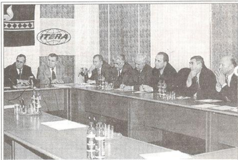
На встрече в администрации Пуровского района

После экскурсии по Харампуру вертолет доставил представительную делегацию на газовое месторождение, которое компания "Итера" эксплуатирует совместно с предприятием "Ноябрьскгаздобыча". Губкинский газовый промысел был сдан в эксплуатацию в мае 1999 года. С тех пор добыто 15 млрд. кубометров газа. Процесс добычи здесь настолько автоматизирован, что при эксплуатации 74 скважин, в смену работают всего лишь 7 специалистов.