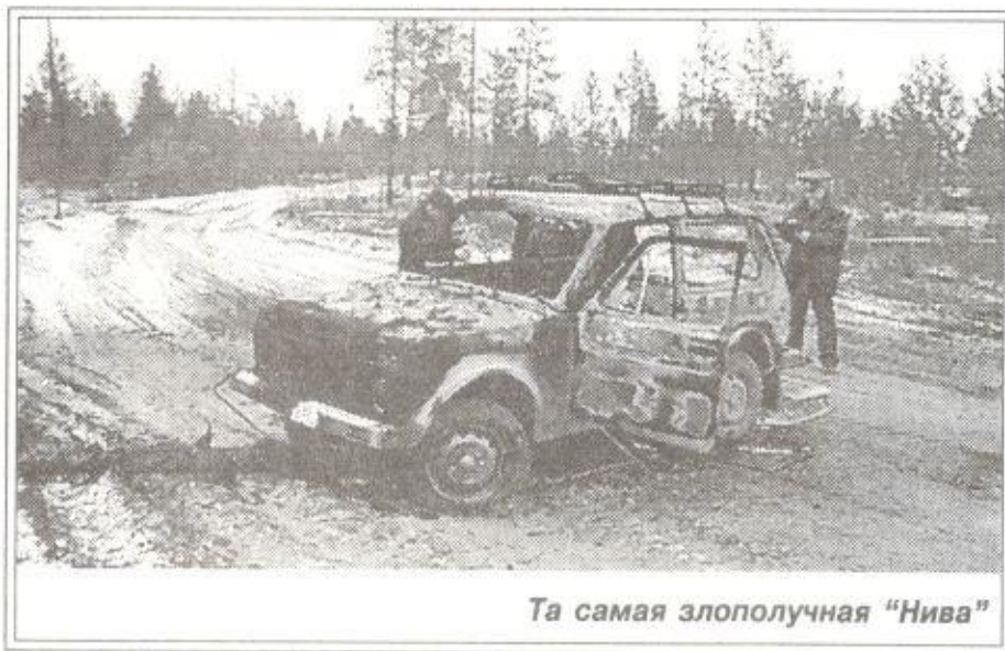
Та самая злополучная "Нива"

Так, 15 октября из окна своей квартиры в одном из домов по ул. Новой в п. Пуровск, 37-летний мужчина заметил, что незнакомый молодой человек с большой сумкой в руках, показавшийся ему подозрительным, пытается взломать дверь иномарки соседа, который в данный момент нахо-