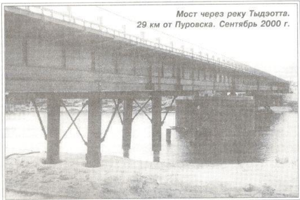
Мост через реку Тьдэотта. 29 км от Пуковска. Сентябрь 2000 г.