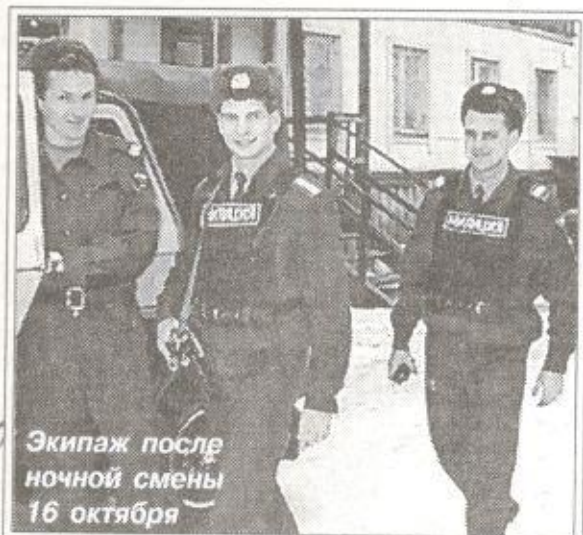
Экипаж после ночной смены 16 октября

29 октября - День образования вневедомственной охраны