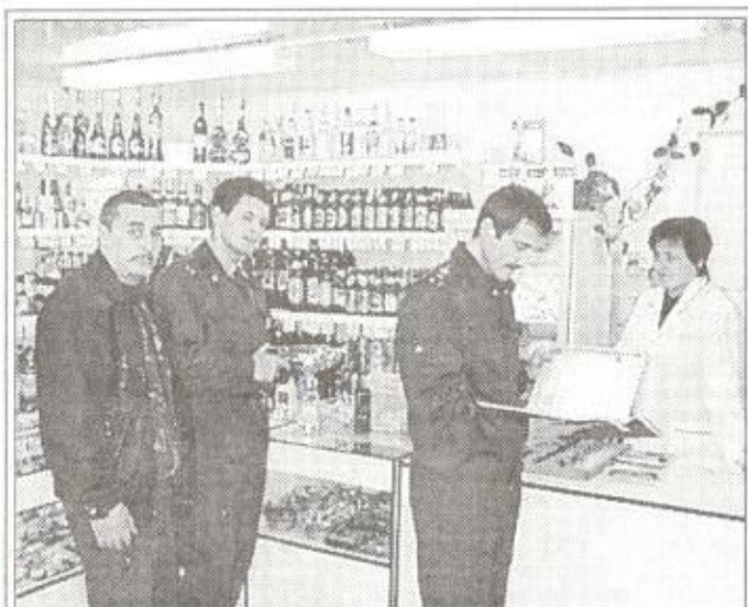
Проверка торговли спиртными напитками в магазине "Мари" на ул. Мезенцева в райцентре

Реальным препятствием на пути нарушения наших потребительских прав со стороны нечистоплотных предпринимателей стала деятельность группы Пуровского РОВД с необычной аббревиатурой - БППРИАЗ, что расшифровывается как борьба с правонарушениями на потребительском рынке и исполнение административного законодательства.